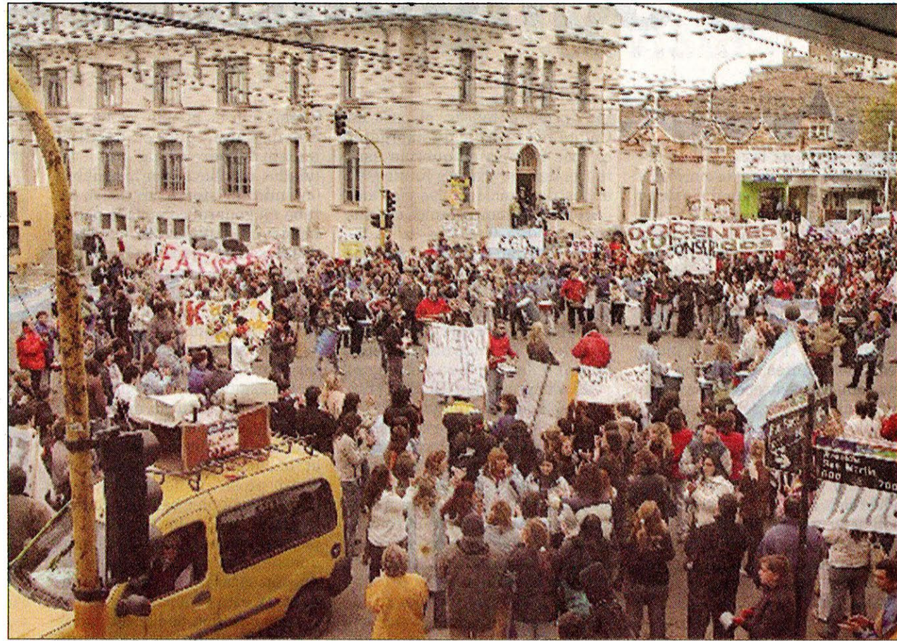
Está planteada la convocatoria de una Asamblea General de los empleados públicos y la realización de un paro y movilización por un aumento de emergencia y la elevación sustancial de los básicos.

Está en crisis una iniciativa que se pergeñó bajo Sancho: que el Banco de Santa Cruz liquide los sueldos de los empleados públicos y los im-