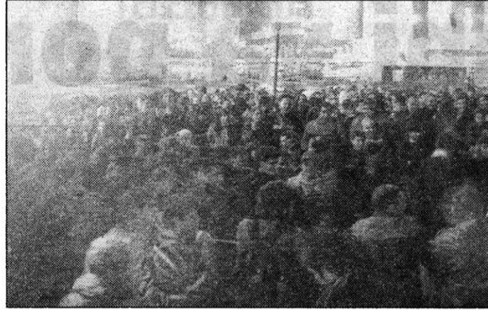
países de América Latina sobre las luchas populares de nuestro continente y se realizarán mesas redondas con la participación de los realizadores y de militantes populares. Las sedes serán el Com-