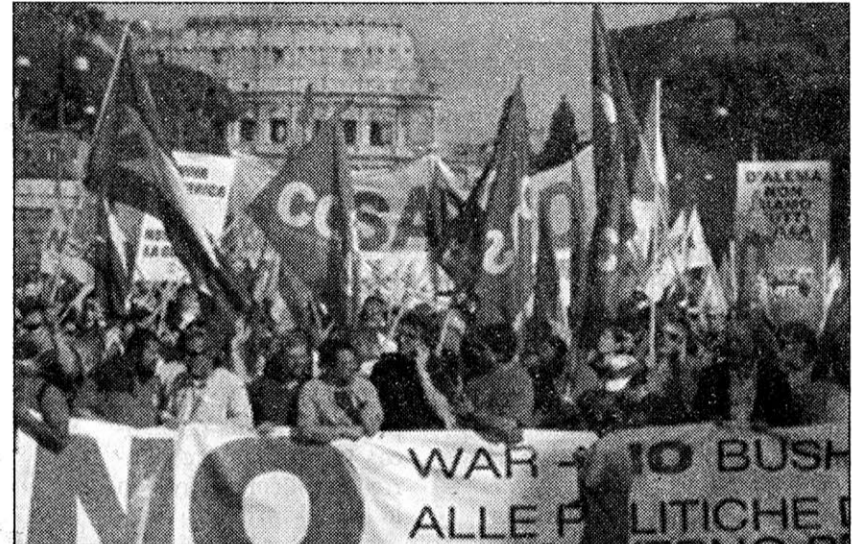
Roma, 9 de junio: La manifestación contra Bush, contra Prodi y contra la guerra.