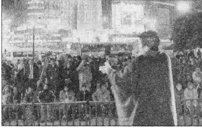
El viernes 7, en el Obelisco, comenzó la cuarta edición del Festival de la Clase Obrera (Felco). Durante toda una semana, se exhibirán videos y cortos de realizadores de Argentina y de diferentes