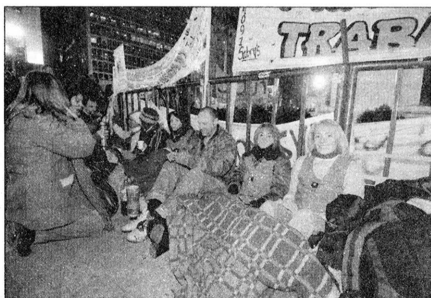
Plaza de Mayo, Viernes 1º: Acampe de los trabajadores del Casino.