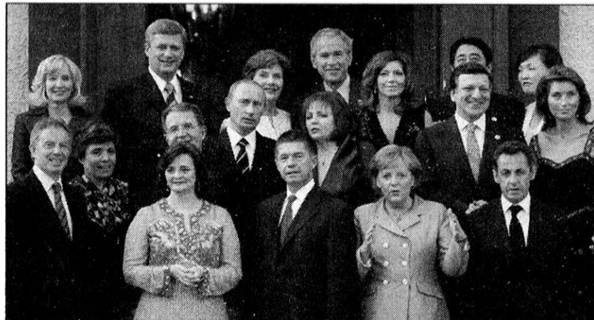
Los miembros del G-8: Sonrisas solo para la foto.

la población mundial. Frente a esta perspectiva, que ya está comenzando a concretarse, el imperialismo mundial está mortalmente dividido.