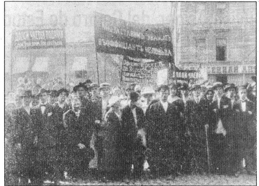
Manifestación de camareros en huelga.

La cuestión de quién mandaba en las fábricas y centros de producción se transformaba, por lo tanto, en un problema de poder. Siempre ha sido así... siempre será así en el contexto de to-