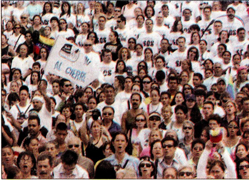
Una movilización reaccionaria manipulada por la Iglesia y el imperialismo.

Ese mismo lector se equivoca cuando dice que apoyamos el quite de la licencia a la televisora gorila y golpista RCTV.