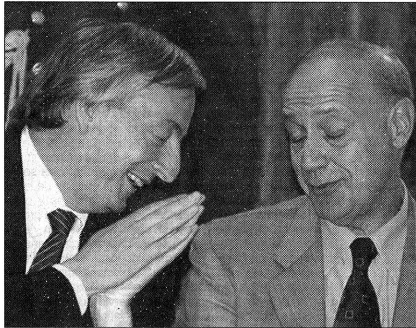
Los padres del canje de la deuda.

Pero hay otra cosa más a tener en cuenta: el creciente endeudamiento del Banco Central, que va por los 15.000 millones de dólares. Porque aunque es cierto que el Central tiene el doble de esa suma en reservas, por las