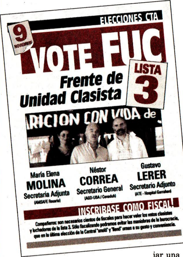
Tapa del programa de la Lista 3, Frente de Unidad Clasista.

aparato, en el mejor de los casos. En el peor, comprende que es imprevisible y prepara un fraude.