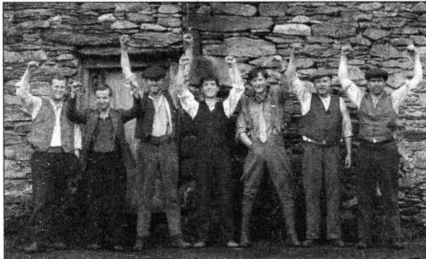
El viento que acaricia la pradera. La última película de Ken Loach conmueve, enseña y, también, transforma.

1920, el gobierno británico desconoce las elecciones parlamentarias en la que el Sinn Fein -independentista- ganó por una abrumadora mayoría. Al calor de la reciente Revolución Rusa, la radicalización de las masas trabajadoras y campesinas le otorgan un auge al IRA, que llama a desconocer a los colonialistas y a sumarse a la guerrilla para combatirlos. Damian (Cillian Murphy) acaba de recibirse de médico y planea mudarse a Londres para ejercer su profesión, pero los asesinatos y torturas del ejército británico -y la insistencia de