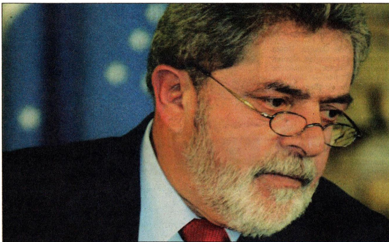
Lula reconoce que no gana en primera vuelta. Los resultados del primer turno han desatado un principio de crisis política en Brasil y en el plano internacional.

La ventaja de Lula debería ser suficiente para retener la presidencia. El problema es que los nuevos episodios de corrupción no han concluido, o sea que jugarán un papel de primer plano en las tres semanas que van hasta el segundo turno. También pesará el ascenso de su rival, que durante la mayor parte de la campaña no era capaz de superar el tramo que va de los 28 y 35 puntos. Lula aborda la próxima etapa electoral en calidad de derrotado. También pesará la crisis con Bolivia, que Lula pensaba resolver el próximo 12 de octubre. La crisis de las nacionalizaciones bolivianas interfiere directamente en la segunda vuelta. La segunda vuelta está condicionada por una crisis de conjunto. La pequeña burguesía codiciosa y arribista que se instaló en la dirección