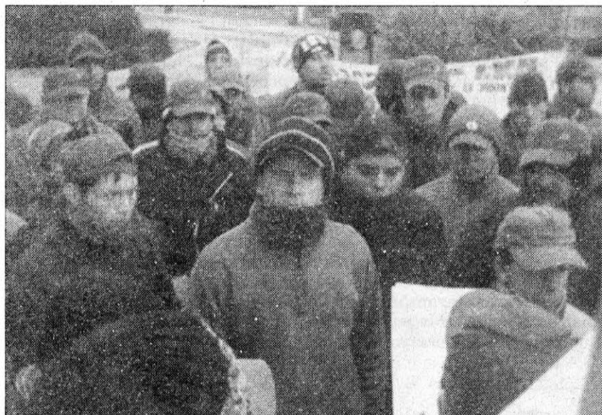
La nueva etapa. Preparar la resistencia y la unidad contra aprietes, sanciones o nuevos despedidos; y aprovechar toda nueva oportunidad para plantear la reincorporación de los compañeros que quedaron afuera.

La ilusión legalista del PTS no podía quedar más clara. En efecto,