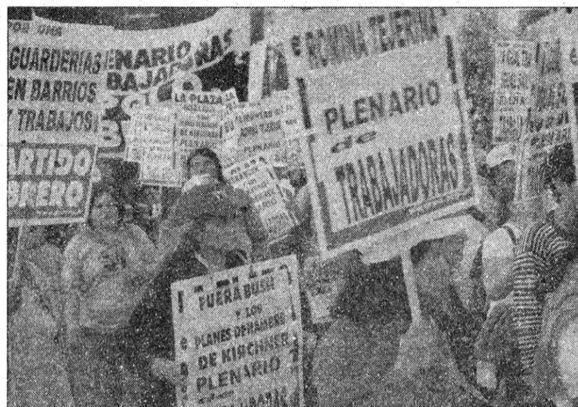
Faltan pocos días para el Encuentro Nacional de Mujeres. Es hora de convertirlo en una gran asamblea que resuelva un plan de lucha.

Pero las mujeres tampoco tenemos derecho a regular la maternidad, a elegir si queremos tener hijos o cuántos hijos queremos tener. La Ley de Procreación Responsable, que establece el derecho a una an-