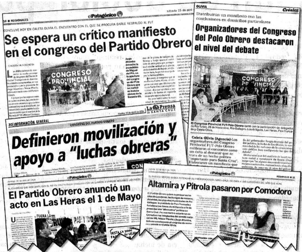
La repercusión del Congreso en la prensa local.

Las resoluciones centrales del Congreso fueron un manifiesto y un plan de lucha del Partido Obrero que apuntale el reguero de luchas. Las dos resoluciones por la libertad de los presos, por la reincorporación de los cesantes, por el reencuadramiento sindical en convenios más favorables, para frenar la persecución de los delegados petroleros por parte de las empresas y la propia burocracia sindical del gremio. Servirán para que los mineros del Turbio