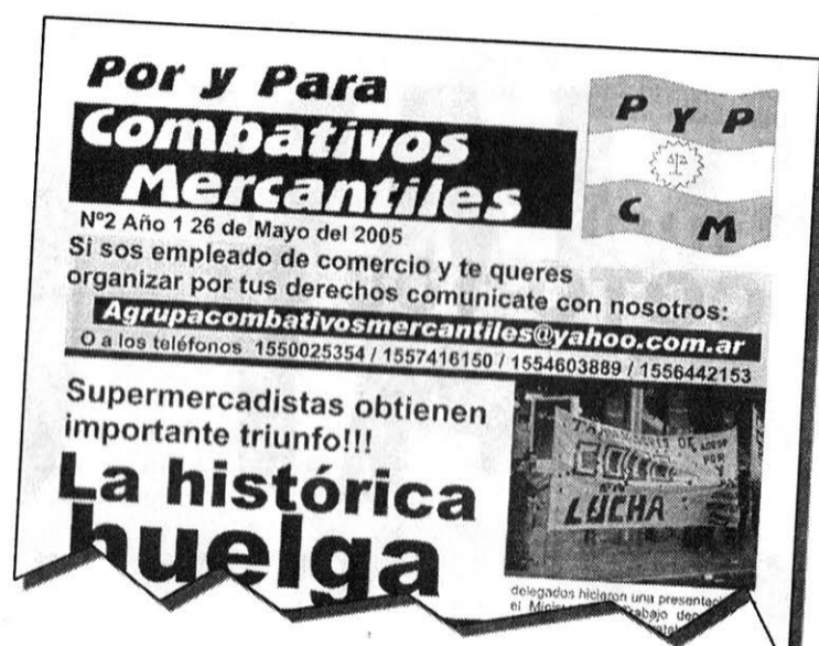
Boletín de la agrupación POR Y PARA COMBATIVOS MERCANTILES

Respeto de la jornada de 8 horas, no a las violaciones al pago de extras. Rechazamos las jornadas extendidas, el banco de horas (con "recuperación" de horas según la conveniencia de la empresa) y cualquier otra forma de violación a la jornada legal establecida en la LCT.