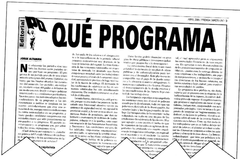
El Partido Obrero plantea un programa para terminar con la miseria social ( Prensa Obrera N° 897)

El No franco-holandés debería sonar como una alarma para Kirchner -y no solamente por la repercusión negativa que deberá tener a mediano plazo sobre el comercio internacional, del que depende la 'recuperación' argentina. Ni tampoco, exclusivamente, por el impacto que el progresivo default de la deuda italiana tendrá sobre las deudas externas como las de Argentina. A los Kirchner