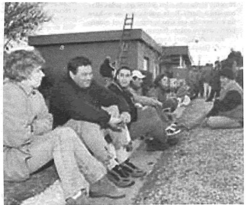
Obreros de Gatic resistiendo el desalojo