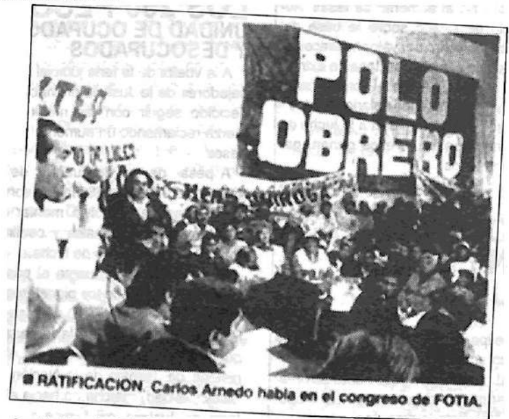
Facsímil diario El Siglo, de Tucumán, 6/8/04

"Esta concurrencia es un respaldo a la lucha y demuestra dónde están los dirigentes que no traicionan: acá, convocando este congreso." ■