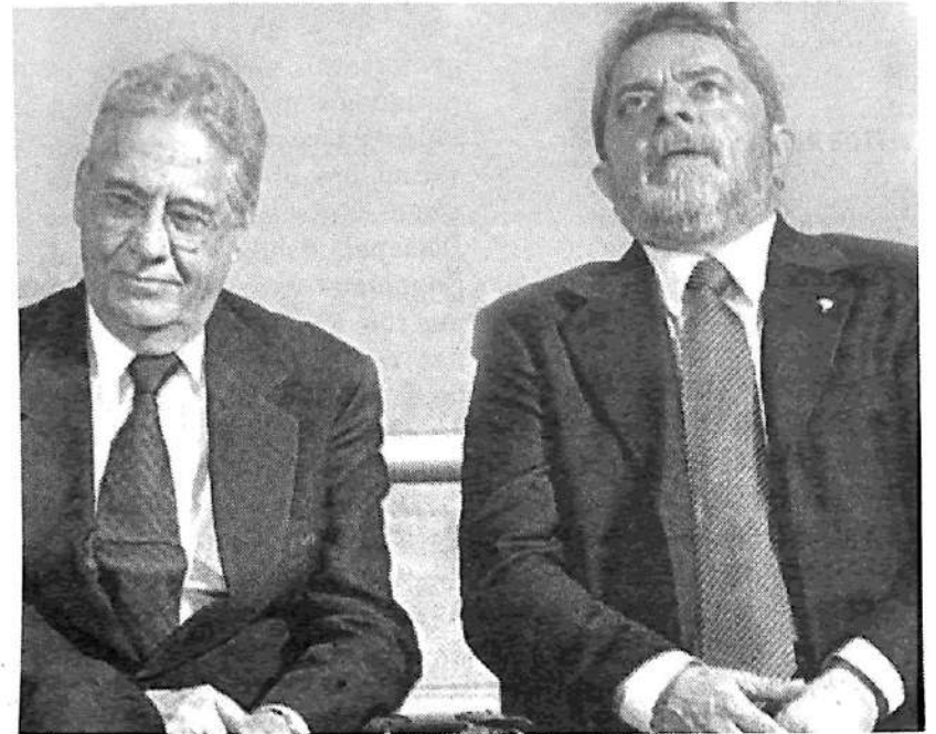
Fernando Henrique Cardoso y Lula

Está claro que tanto la ESD como el MNPS no son siquiera un inicio de solución de la monumental crisis del PT.