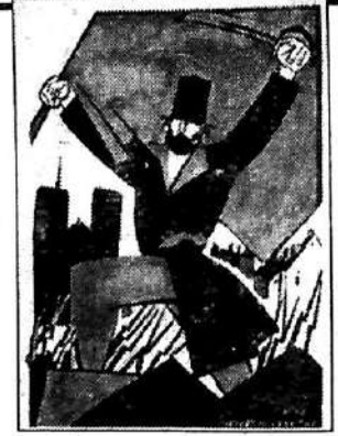
La Comuna de París, la primer dictadura del proletariado

tendencias burocráticas. Pero, en tanto Estado obrero, será la dictadura del proletariado.