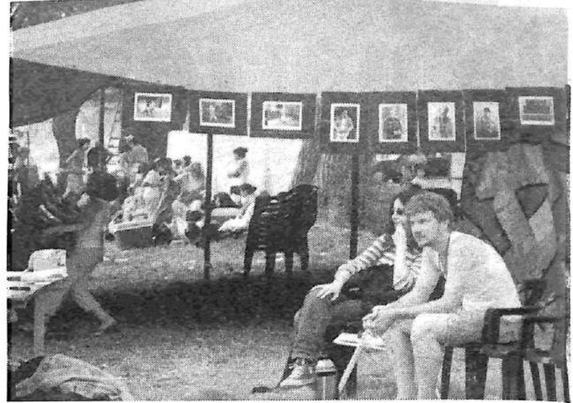
Carpa del Ojo Obrero, muestra fotográfica y proyecciones.