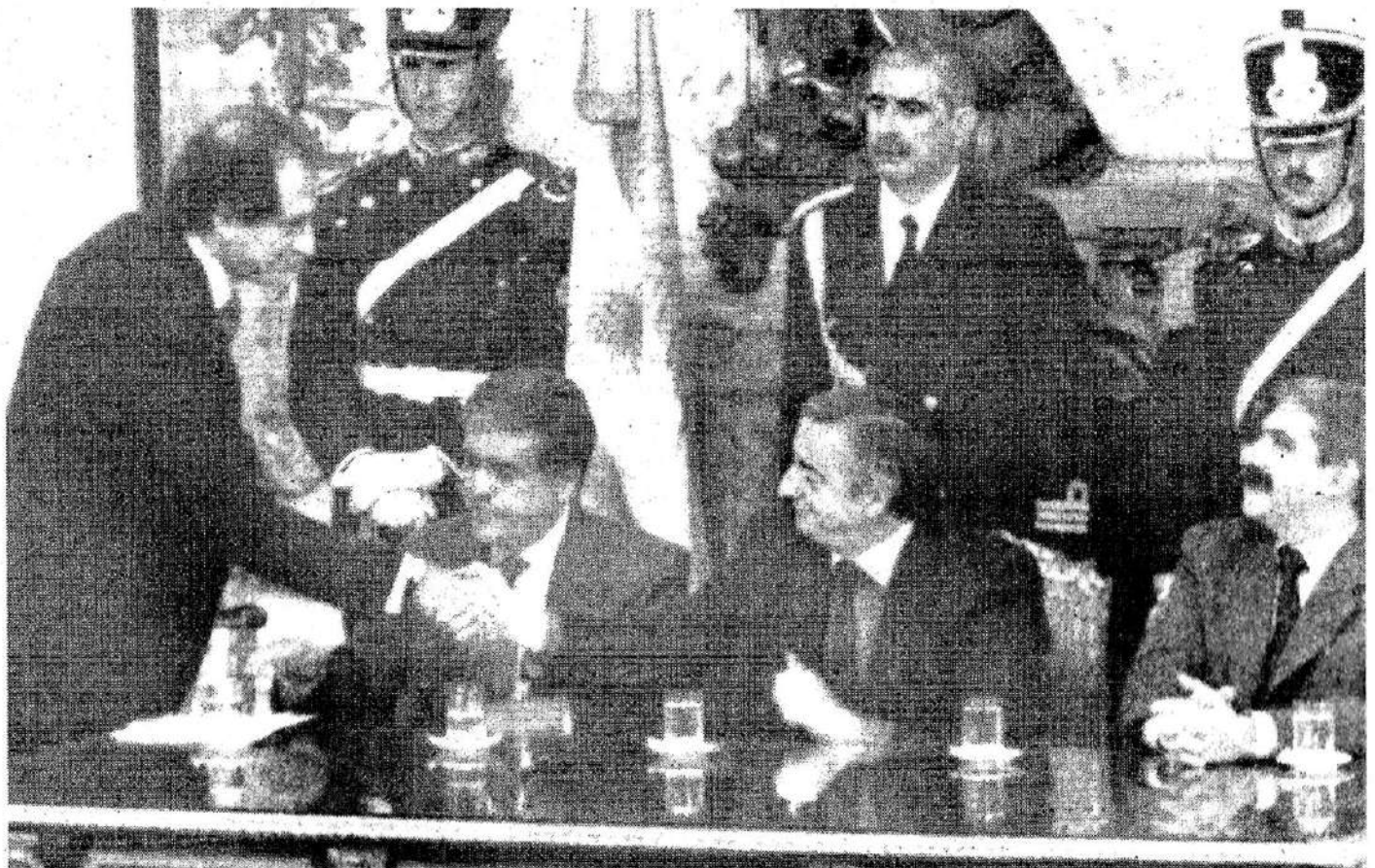
Kirchner hace felices a los banqueros "nacionales" con préstamos garantizados a tasa usuraria

Ni les irá bien de aquí en más: Kirchner