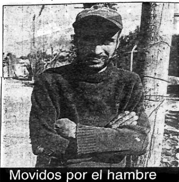
Movidos por el hambre

El movimiento piquetero no tenía en la provincia hasta el presente, una perspectiva clasista, sino más bien "asistencialista", dirigida a atender exclusivamente a los desocupados. Esas organizaciones piqueteras provinciales (Ccc, Teresa Vive, Aníbal Verón, y aun el Mtl) ni siquiera conforman un frente común de lucha. No es casual que en los reportajes que nos hicieron, las preguntas giraron obligadamente sobre cómo se plasmarían en San Juan los planes de lucha de la ANT. Nuestra respuesta fue contundente: junto a la lucha por la duplicación del monto de los planes y los bolsones de comida, defendemos las