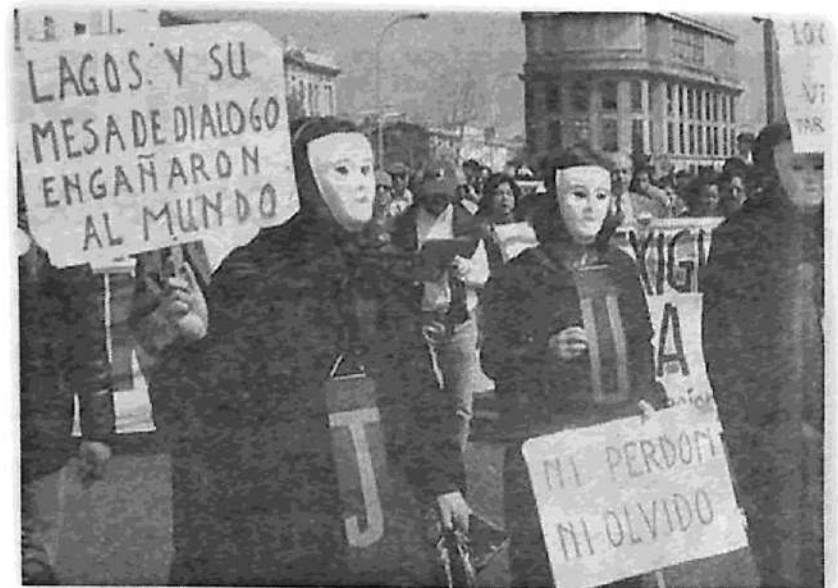
Santiago: Manifestantes denuncian la impunidad de Lagos y la Democracia Cristiana.

uno de los biógrafos del Che-: "Toda la apuesta del gobierno de Allende había consistido en utilizar únicamente los recursos de la legalidad burguesa... sin recurrir a los fusiles, sin armar al pueblo... De modo que cuando vino el vendaval y el Palacio de la Moneda fue bombardeado, el conjunto de la izquierda chilena se encontró ampliamente desprevenido y la tragedia fue total. Fue un salvase quien pueda generalizado".