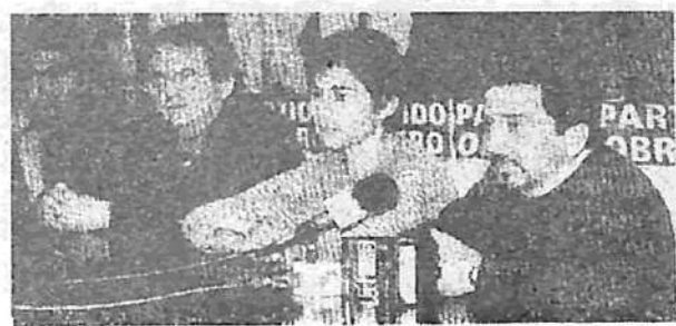
Jorge Mora será el candidato a gobernador de la coalición que conformaron Izquierda Unida y el Partido Obrero.