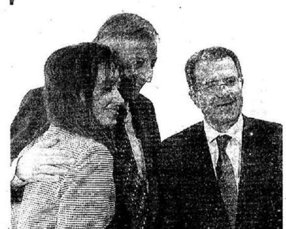
De arriba a abajo: Kirchner con el británico Blair, el francés Chirac, el alemán Schröder y el italiano Prodi, de la Comisión Europea.