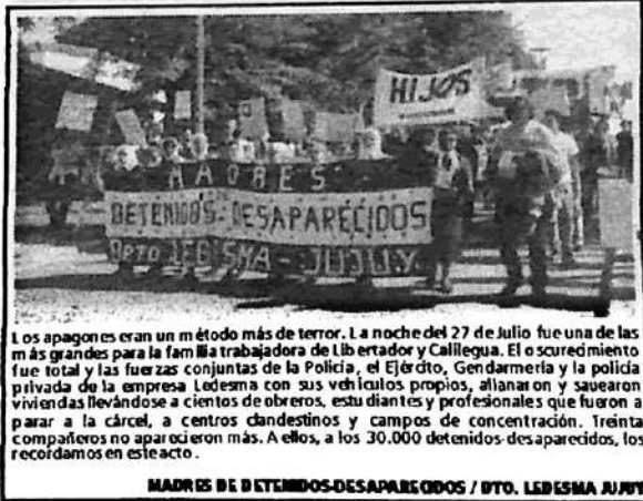
Los apagones eran un método más de terror. La noche del 27 de julio fue una de las más grandes para la familia trabajadora de Libertador y Calliagua. El secuestro fue total y las fuerzas conjuntas de la Policía, el Ejército, Gendarmería y la policía privada de la empresa Ledesma con sus vehículos propios, allanaron y saquearon viviendas llevándose a cientos de obreros, estu diantes y profesionales que fueron a parar a la cárcel, a centros clandestinos y campos de concentración. Treinta compañeros no aparecieron más. A ellos, a los 30.000 detenidos-desaparecidos, los recordamos en este acto.