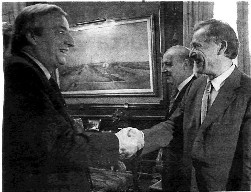
La trenza de Kirchner y Lavagna con el FMI lleva a Argentina al derrumbe