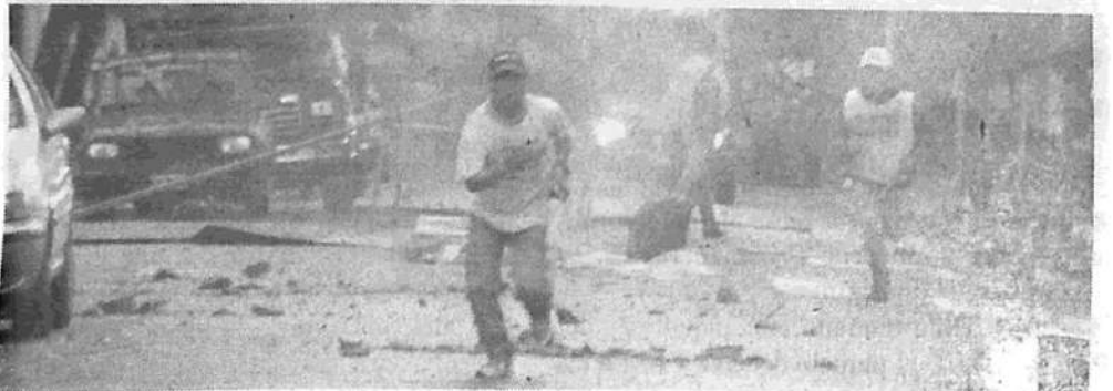
Represión policial en Sasetru y Brukman