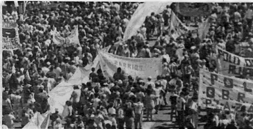
La gran movilización de los días 22 y 23 de febrero, que recorrió toda la Capital.

Las imágenes recorrieron el mundo por la CNN y esto ya constituyó una acción concreta de movilización y de lucha contra el golpe de los monopolios petroleros y el imperialismo que impulsa el lock-out en Venezuela. Pero además, en esas horas, dos millones de venezolanos ganaban las calles en Caracas. Nos movilizamos simultáneamente con ellos, luchando codo a codo. El Polo Obrero señaló allí, como lo hizo en el breve discurso del acto a la salida, que la lucha