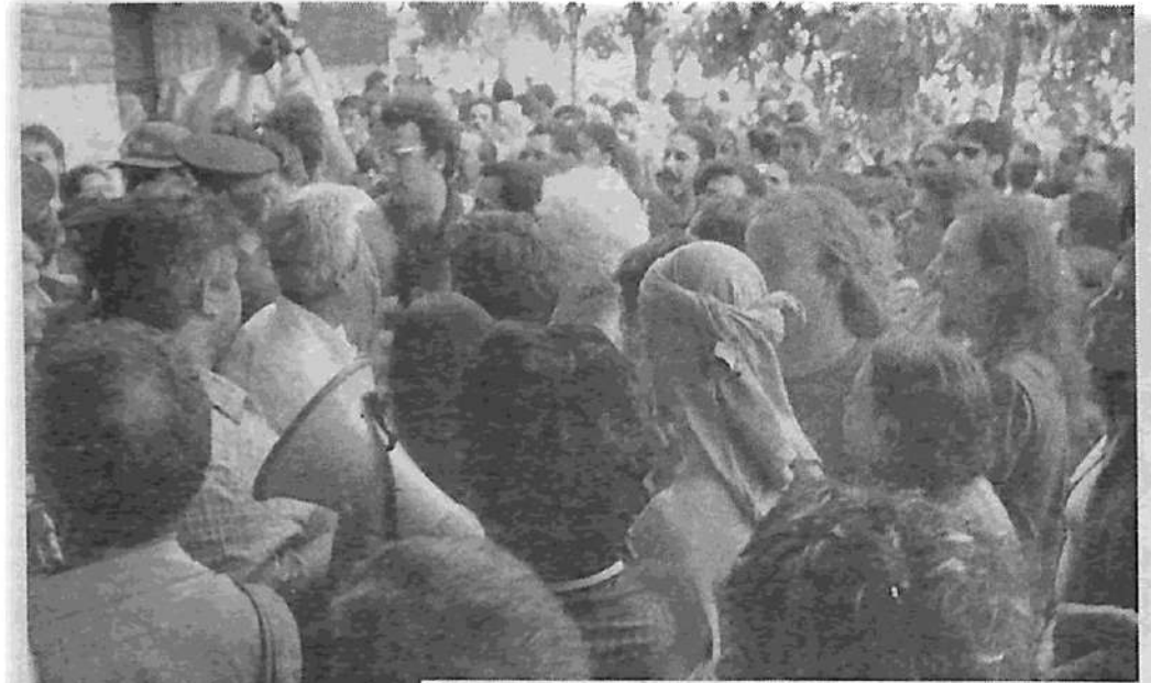
Imágenes de la jornada del domingo 24, en Brukman

La ofensiva lanzada por la patronal de Brukman, consumada a través de este allanamiento policial, actualiza la necesi-