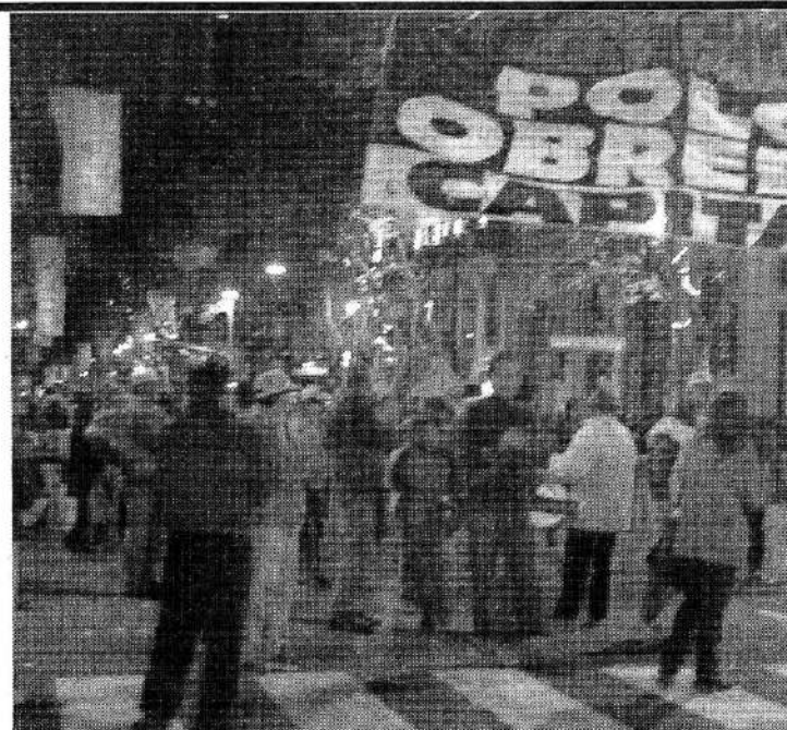
Acampe del Polo Obrero de Capital el 22 de octubre, carpas en la Av. de Mayo

Fuera Duhalde, los saqueadores y el FMI Por una Asamblea Popular Constituyente