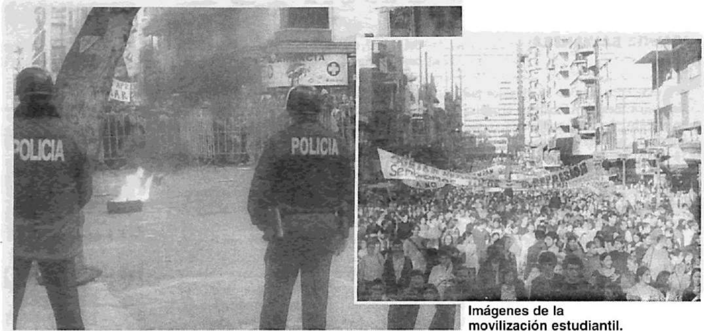
Imágenes de la movilización estudiantil.

Con la "valentía" que le faltó para enfrentar a los banqueros que saquearon al Uruguay, Batlle intentó mostrar "fuerza" enviando a la policía a desalojar dos colegios secundarios ocupados por sus estudiantes.