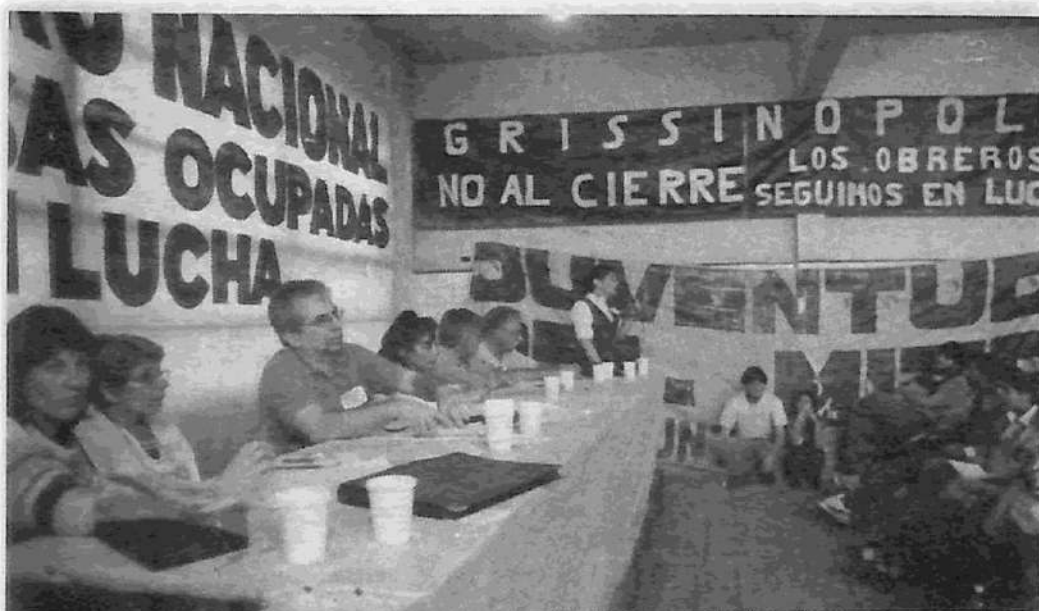
Imágenes de la mesa que encabezó el Encuentro en Grissinópolis.