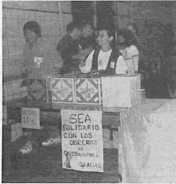
Hasta hubo grisines para los participantes del Encuentro en Grissinópolis...

Los trabajadores insisten en el reclamo de la reapertura de la planta.