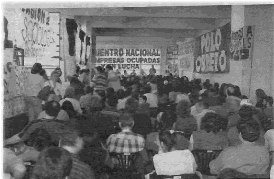
Masivo encuentro de empresas ocupadas y en lucha el sábado 24 en Grissinopoli.

El FMI ha reiterado que no aceptará ningún acuerdo hasta que el Estado no recapitalice los bancos, que se aumenten las tarifas, que se privatice la banca pública y que se restablezcan las ejecuciones hipotecarias. Echa leña al fuego, porque la contradicción de este planteo es flagrante: con mayores tarifas, ejecuciones y empapelamiento del Estado con títulos públicos, mayor será la depresión económica. Como lo demuestran las crisis de Uruguay, Brasil, Ecuador, Perú y otros, los capitales internacionales se están retrayendo por la necesidad de hacer frente a los déficits financieros que tienen en los países centrales, de modo que no volverán a Argentina como consecuencia de un acuerdo con el Fondo. Ahora mismo, Lavagna está impulsando un gigantesco saqueo de las finanzas públicas al legislar que los impuestos puedan ser pagados con títulos