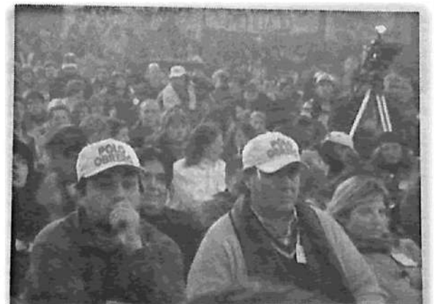
Imagen de la Asamblea Nacional de Trabajadores del 22 de junio pasado.

A esta tentativa de integración que promueve el Estado patronal, debemos oponerle un frente de empresas ocupadas independiente del Estado para luchar en común por la creación de una red única de fábricas autogestionadas, financiada por el Estado, a través de una banca estatal única bajo administración obrera.