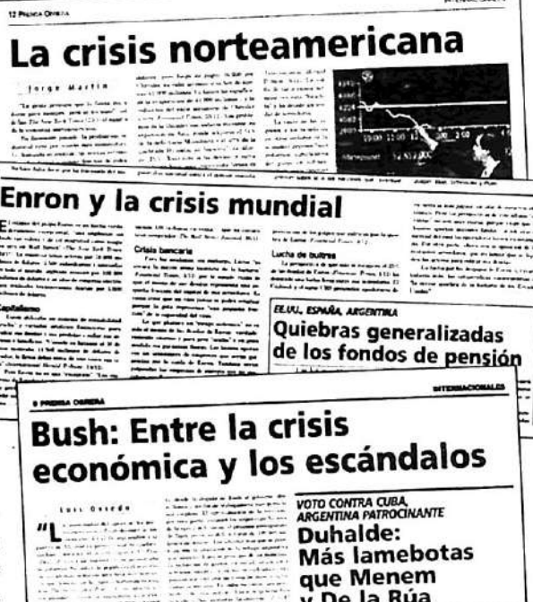
Facsimiles de artículos publicados en Prensa Obrera . De arriba hacia abajo PO N° 696 (8 de febrero de 2001), PO N° 734 (20 de diciembre de 2001) y PO N° 740 (7 de febrero de 2002).

laborales; baja sistemática de los salarios). A pesar de esta exacción, a finales de los '80, los resultados eran miserables en términos de recuperación de la actividad capitalista. Las quiebras bursátiles de los años '87 y '89, el desbarranque de una parte del sistema financiero de los EE.UU. (las sociedades de ahorro y préstamo) la recesión de Japón, y de Alemania así lo demostraban.