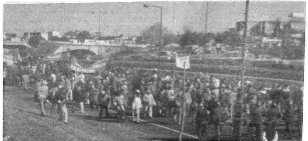
Los piqueteros cortando General Paz y Panamericana, en la jornada del miércoles 26.