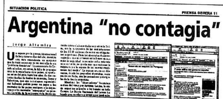
Prensa Obrera N° 737

• "(...) la crisis argentina ya está profundizando la crisis del resto de América Latina, que también quiere hacerle frente con la devaluación (...) Se ha abierto una nue-