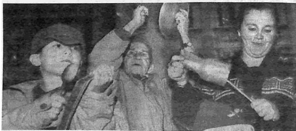
El cacerolazo en Uruguay

Kuczynski, un hombre ligado por décadas al Citibank, acaba de afirmar que "la privatización llegó al fin del camino en América Latina (porque) no queda suficiente dinero para nuevas privatizaciones" (Clarín, 5/6). Esto, por un lado, porque la crisis argentina ha golpeado a los bancos que las financiaban, pero también porque la crisis de las telecomunicaciones, a nivel mundial y en nuestro continente, ha obligado a mandar a pérdida capitales por varias decenas de miles de millones.