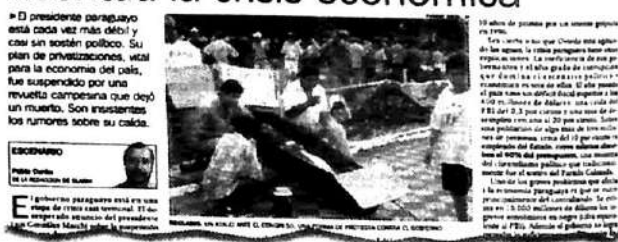
Un grupo de campesinos en un momento de la protesta contra el gobierno de González Macchi.

Paraguay: la inestabilidad política acentúa la crisis económica