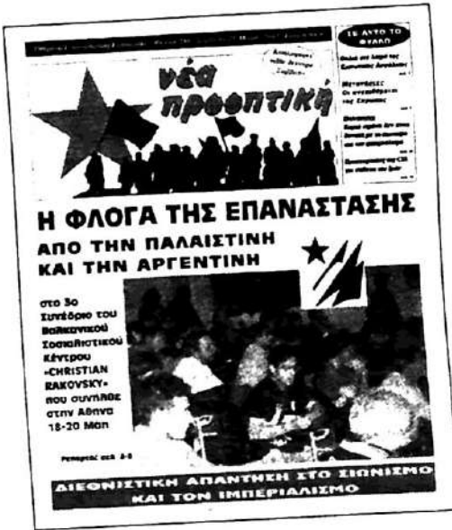
Faccimiles de los periódicos del EEK y la NAR, de Grecia, que reflejaron la conferencia del centro Raskovsky.