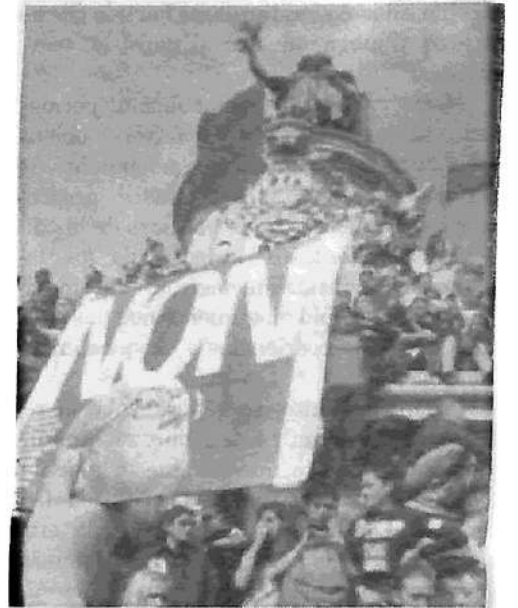
Imágenes de las movilizaciones contra Le Pen, en París.

El lambertista Partido de los Trabajadores (PT) desarrolló una campaña centrada en la "democracia", la "importancia central del sufragio universal" y los "valores de la democracia comunal". Su oposición a la Unión Europea es muy cercana a la de los "soberanistas" nacionales que ven en el Es-