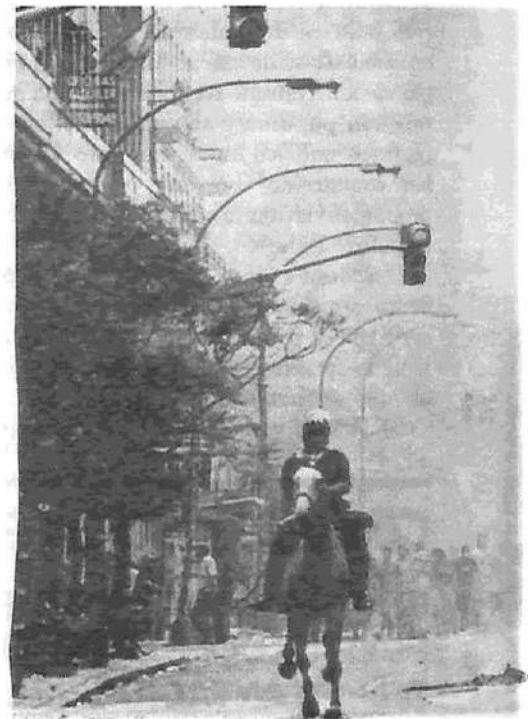
Diagonal Norte, 16 hs: el pueblo hace retroceder