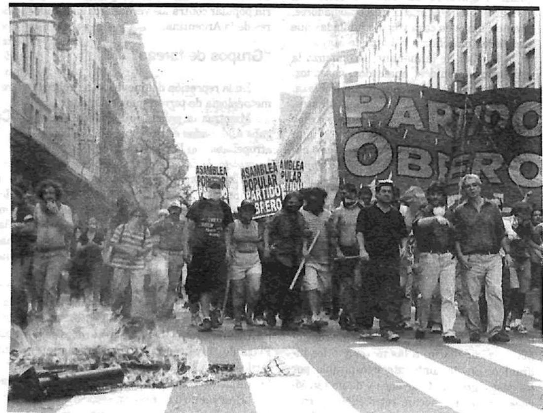
La columna del Partido Obrero, al pasar frente al edificio de Repsol-YPF.