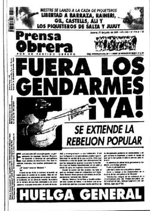
Tapa de Prensa Obrera 21/6/2001. En el norte salteño, el proceso de la rebelión popular promovió una dirección clasista.

za el gran corte de La Matanza, que rápidamente se extiende a todo el Gran Buenos Aires. Paralelamente, estalla una nueva pueblada en el norte salteño: es la primera expresión general de la "Argentina Piquetera"; ya llegarían otras, más profundas y coordinadas.