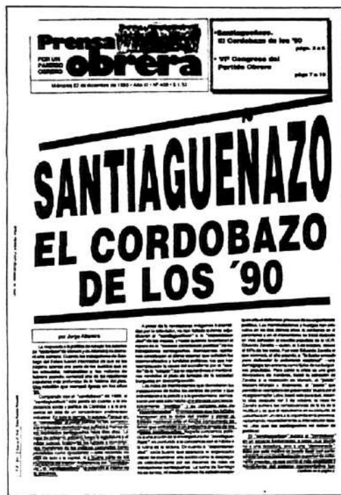
Tapa de Prensa Obrera 22/12/93. El Santiagueñazo de diciembre de 1993 abrió un nuevo rumbo para las masas explotadas. Una década después, el camino que se inició en Santiago llegó a la Plaza de Mayo.

Tercero, porque los piqueteros exigieron derecho de voz y voto en la distribución de víveres, es decir que opusieron el derecho a