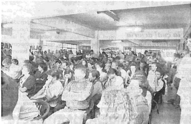
Una vista de la concurrencia piquetera.