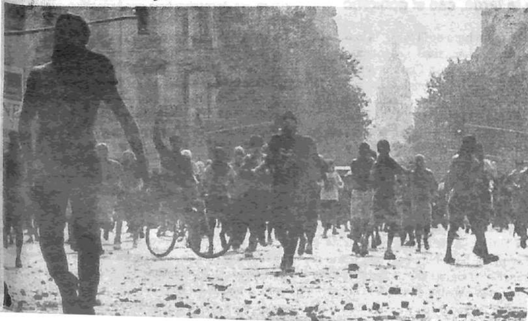
La batalla en avenida de Mayo.

En las primeras horas del jueves, Mestre y Mathov conspiran con los jefes policiales: la orden es "despejar la Plaza de Mayo". Saben que la movilización es imparable. Ya no les alcanza el "estado de sitio": los asesinatos, los heridos, las detenciones ilegales, las torturas y la reaparición de los "grupos de tareas" son entera responsabilidad política de estos "demócratas" aterrorizados.