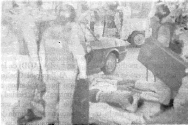
La bonaerense de Ruckauf batió todos los records: 2.400 detenidos y 9 muertos.

En Buenos Aires, los "operativos de inteligencia" de la policía provincial y de la Side estuvieron a la orden del día. Fueron ellos los que desataron la psicosis de los "saqueos a las