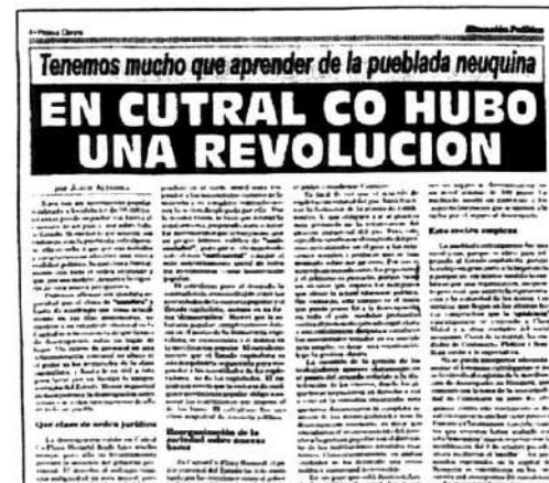
Prensa Obrera 4/7/1996. Los piqueteros del Cutral-Co plantearon que había que "meter mano" en los superbeneficios de las privatizadas.

En el curso de 45 días, estallaron enormes puebladas en Neuquén, Salta, Jujuy y Córdoba, en las que se movilizaron y lucharon decenas de miles de piqueteros. Su rasgo común fue, en primer lugar, la dominación política sobre el movimiento de masas que ejercían sectores patronales y pequeño-burgueses —a través de las llamadas "multisectoriales"— y la política con que los enfrentó el gobierno menemista: fracasada la represión, combinó la oferta "planes Trabajar", con las manipulaciones políticas de las "multisectoriales" y la Iglesia para desarmar a