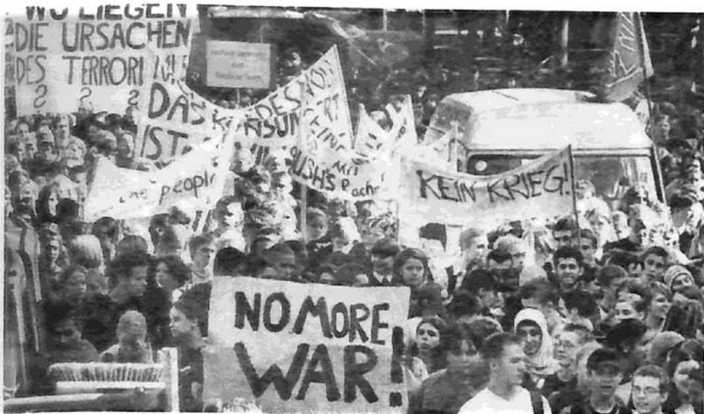
Movilización contra la guerra en Berlín