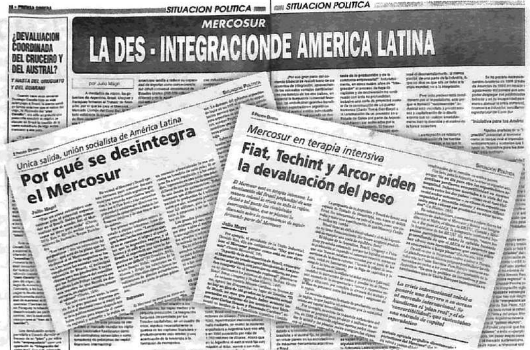
En Prensa Obrera fuimos anticipando el fracaso del Mercosur.

Sin embargo, para Paolo Rocca, el titular del pulpo Techint, "el Mercosur es insostenible como está hasta ahora. No hay razones para invertir en la Argentina si existen mejores oportunidades en Brasil" ( La Nación , 28/9). Pero la inversión en la Argentina ha caído un 30% por año en los últimos cuatro años y no por Brasil, donde la inversión directa es en este momento igual a cero. Techint enfrenta el tremendo peligro de desaparecer si se acepta la posición norteamericana de reducir la capacidad mundial de producción de acero, algo que no ocurriría con los japoneses y franceses que dominan la si-