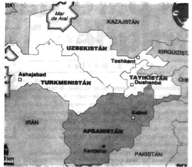
El dispositivo yanqui entorno a Afganistán: está en juego el control del petróleo y el gas del Asia Central

No hay ningún analista de la región que no señale la certeza de que la tentativa yanqui habrá de empanantarse en las