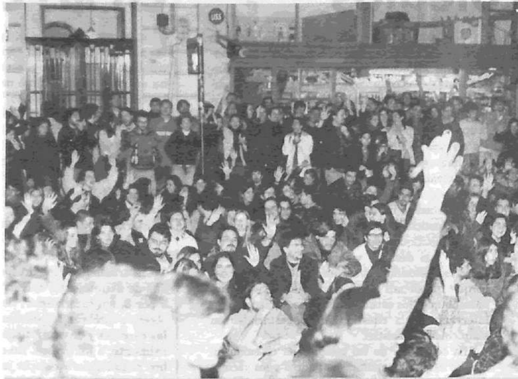
Asamblea en la puerta de la facultad de Ciencias Sociales de la UBA, agosto de 2001.