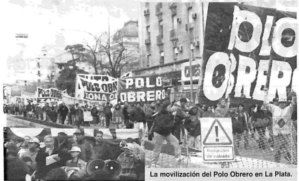
La movilización del Polo Obrero en La Plata.

Los funcionarios encabezados por el secretario de Empleo y con participación del sector Promoción Social firmaron un acta de compromiso de realizar en la semana siguiente una reunión con el ministro Anibal Fernández; de gestionar institucionalmente ante cada intendencia el otorgamiento de puestos de trabajo, y de responder sobre los pedidos de Acción Social en la reunión misma con el ministro