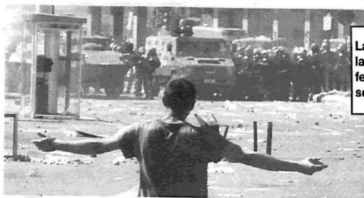
La de Génova (junto con la de Seattle) fue la manifestación con mayor presencia obrera y sindical.

La centroizquierda italiana: los partidos del Olivo, y en particular la DS del ex primer ministro D'Alema, llamaron a suspender las manifestaciones previstas para el sábado y bloquearon la llegada de sus militantes a Génova. La respuesta fue que ese día tuvo lugar la mayor manifestación registrada en Italia en los últimos tiempos.