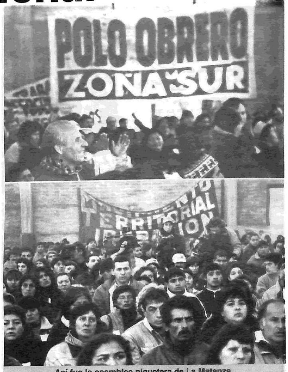
Así fue la asamblea piquetera de La Matanza