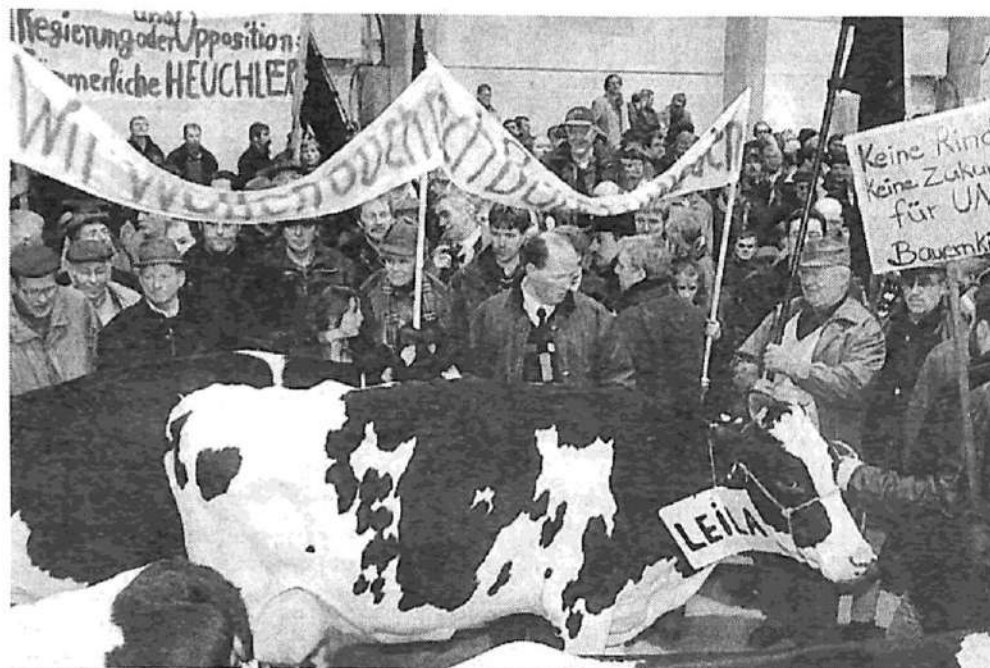
La matanza de vacunos provoca graves enfrentamientos con los productores.

En esta nueva escalada del mal, los capitalistas europeos y sus gobiernos no han