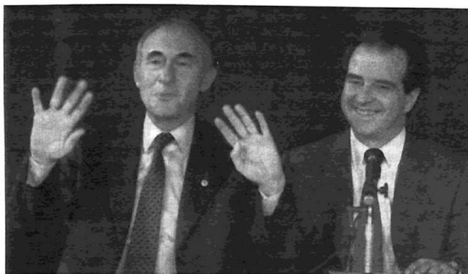
De la Rúa convocó a "recuperar la alegría de vivir". Se refería, claro, a la de los acreedores y capitalistas

los más grandes, acaba de anunciar pérdidas por mil millones de dólares, que algunos atribuyen a los préstamos incobrables que habría otorgado a las distribuidoras de electricidad de California que han entrado en cesación de pagos, y que otros explican por operaciones especulativas que dieron resultados negativos en la Bolsa neoyorquina. También ha ingresado en un cono de sombra el JPMorgan-Chase e incluso el Citi, lo cual explica la abrupta baja de las tasas de interés decidida por la banca central de Estados Unidos. No hablemos ya de la crisis bancaria