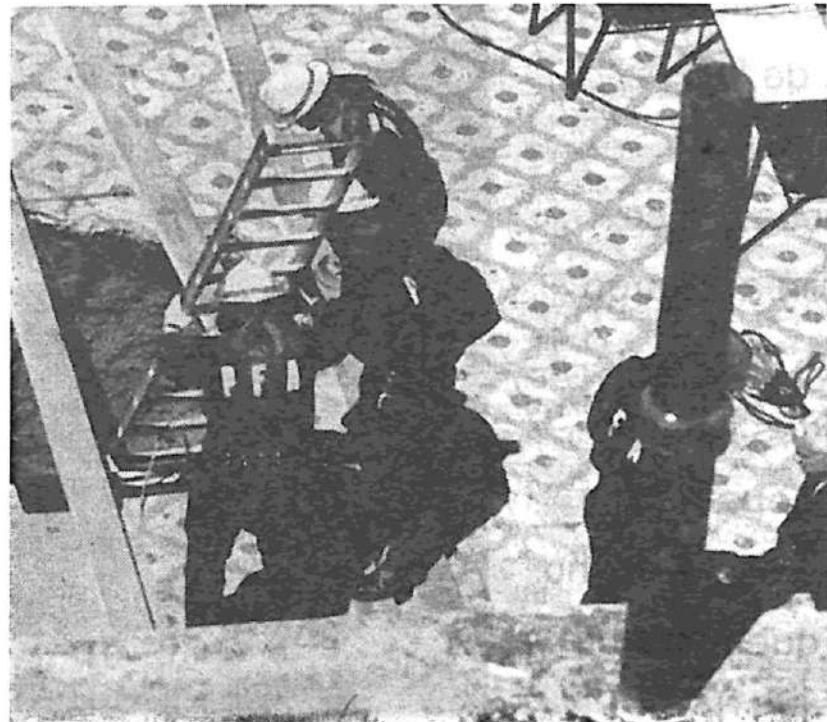
Patio del Mariano Moreno: por este con pozo cayeron los estudiantes

Este desastre era de esperar, ya que nuestro colegio se encuentra en una situación catastrófica. Habían clausurado un aula porque era imposible dar clases en el estado que se encontraba, e incluso hace unos días, cuando una paloma se posó en la cornisa de un patio cayó un pedazo de techo.