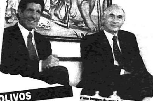
Una imagen de unidad aliancista. El gobierno, al salir de la mañana con el jefe de Estado, Carlos Chacho, se comprometió a dar cuentas dentro de la Alianza, sino para tratar "las necesidades de la gente y los intereses del país", y por ello los temas centrales que abordaron fueron "el crecimiento y el combate a la corrupción".

"La Alianza está unida", fue la frase que eligió De la Rúa para explicar por tierra las especulaciones sobre la ruptura de la coalición, mientras que Alvarez afirmó que seguirá "cooperando en todo lo que esté a su alcance" para el éxito de la gestión del Gobierno.