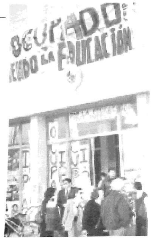
Escuelas ocupadas y se han solidarizado con los reclamos de los secundarios.

ciado en apoyo a la lucha del movimiento estudiantil. Esto a pesar del carácter antigubernamental de las reivindicaciones y de la composición fundamentalmente obrera y popular de los ocupantes: a la cabeza del movimiento están los estudiantes de los colegios técnicos, de los nocturnos y de la barriada obrera y popular del Cerro. Dentro del movimiento sindical, las únicas excepciones a este bloqueo son Adeom —el sindicato municipal de Montevideo— y el sindicato del Taxi, que se han hecho presentes en las es-