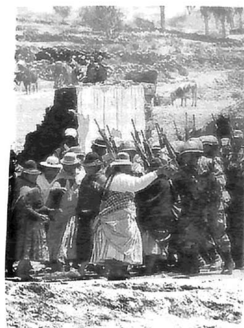
Mujeres campesinas enfrentan a los militares que intentan desalojar un bloque de caminos

La Iglesia ha salido a salvarle las papas a Banzer, organizando directamente las negociaciones del gobierno con los co-