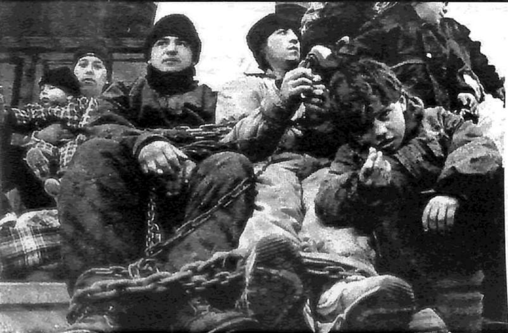
San Antonio Oeste (Río Negro): Obreros de Camaronera Patagónica, a los que se les deben siete meses de sueldo, se encadenaron a las puertas del municipio de esa ciudad, gobernada por la Alianza. Otros, bajo un intenso frío y lluvia, acamparon con sus familias en la plaza. "A esta altura del partido, ya no tenemos nada que perder", declararon los compañeros a la prensa local.