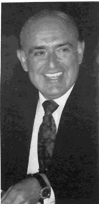
¿De qué se ríe señor gobernador, de qué se ríe?

Su organización masiva y su progreso en un congreso de bases para arrancar las reivindicaciones, especialmente un mínimo de 600 pesos, pue-