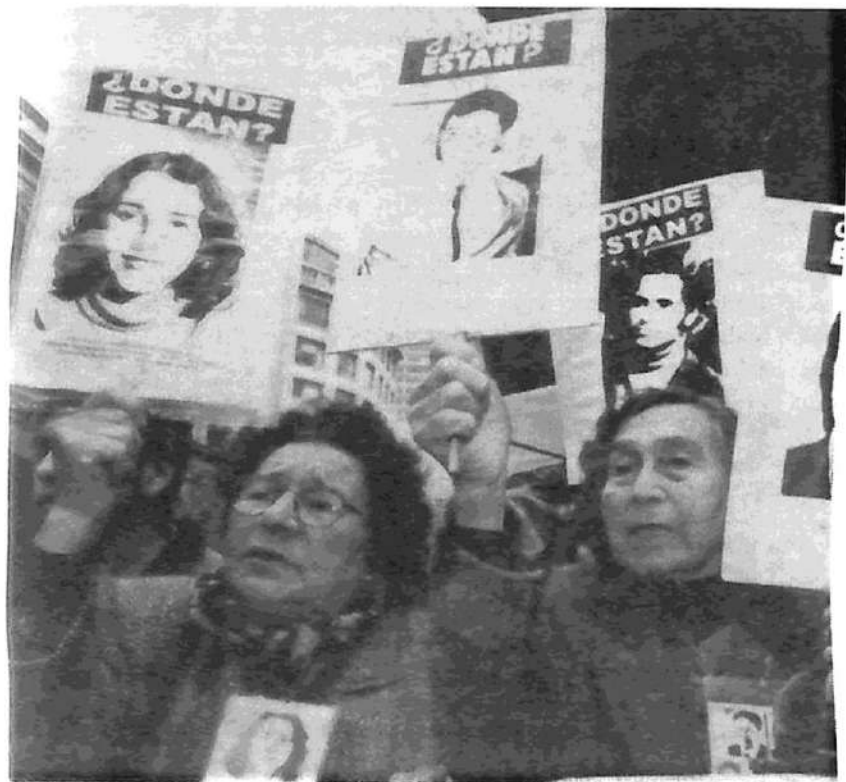
En Argentina como en Chile, Juicio y Castigo a los responsables de los crímenes dictatoriales