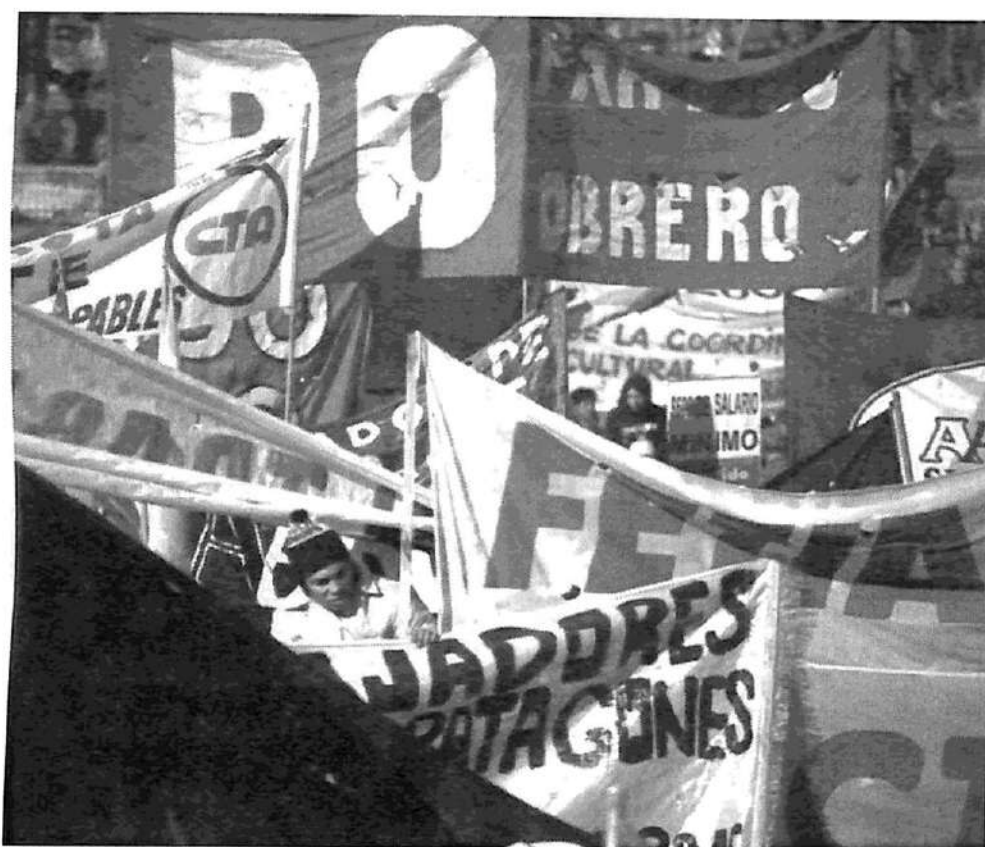
La columna del Partido Obrero en la Marcha del Trabajo

La marcha, con estas características, gozó hasta del apoyo de intendentes y del propio gobierno de la Alianza. Fue declarada de "interés municipal" en Rosario, Moreno y Matanza. Storani, el responsable político de la represión que abatió a los desocupados en Corrientes, pudo decir que "La Marcha nos parece positiva, es por el trabajo, con un proyecto que recolectó adhesiones, vinculado a un mecanismo de contención, un seguro de desempleo", para subrayar a continuación que