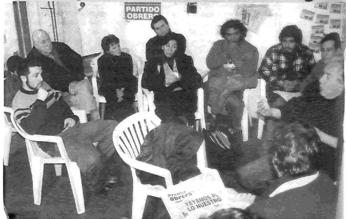
Altamira en Villa Lugano: aspecto parcial de la reunión realizada el sábado 29