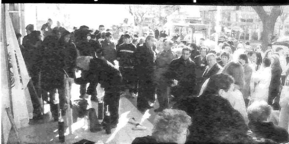
Más de doscientos trabajadores del Ramos Mejía participaron del acto de colocación de una placa que recuerda a los desaparecidos del Hospital