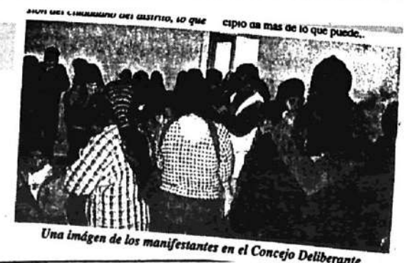
Una imagen de los manifestantes en el Consejo Deliberante