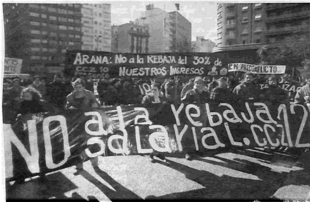
"No a la rebaja salarial": movilización de los trabajadores municipales de Montevideo el día de la asunción del intendente frenteamplista Mariano Arana.

En Adeom (municipales de Montevideo) prosiguen las asambleas de base y el estado deliberativo es creciente. Se prevé la realización de un plenario de delegados y una asamblea general para los primeros días de agosto de todos los municipales de Montevideo. Esto fortalecería la tendencia a la lucha que se hace presente en diferentes sectores y empalmaría con una movida a nivel nacional, en otras intendencias donde se están produciendo despidos y atrasos en los pagos de los salarios, pero donde también se está