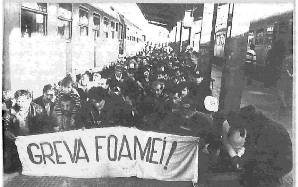
Los desocupados de las minas de carbón, en Rumania, protestan ocupando el andén de la principal estación ferroviaria de Bucarest. Reclaman puestos de trabajo.