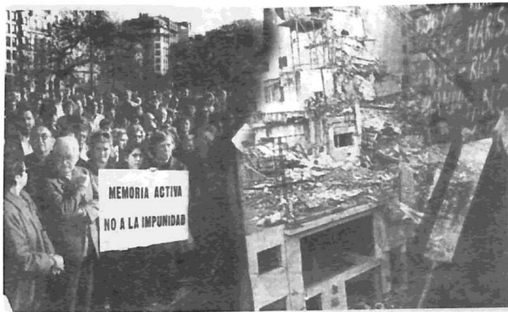
Memoria Activa: No a la impunidad

El Estado argentino (la 'conexión local'), con el patrocinio de los encubridores internacionales ('la conexión interna-