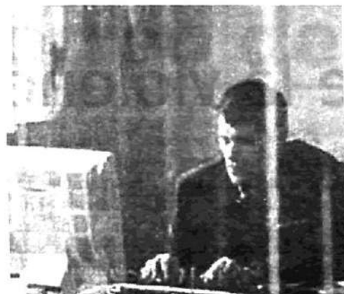
"Recursos Humanos": Las "35 horas" y la flexibilización laboral en el tapete

Los huelguistas toman la fábrica. Este será el momento en que el hijo apaga la máquina del padre y le grita: "Tengo vergüenza de ser el hijo de un obrero, vergüenza de ser tu hijo, vergüenza de tener vergüenza; y vos me generaste esa vergüenza, vos vos el que no ama a su clase. Y ahora hasta tengo vergüenza de estar preparado, de saber hablar para defender a la patronal". Este enfrentamiento despertará al padre, que pasa a participar activamente en la toma de fábrica.