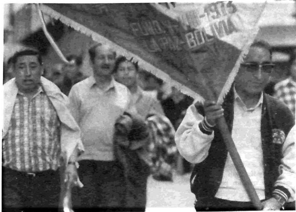
Cochabamba: Movilización campesina

Y, en el movimiento obrero y popular, ya no se trata sólo de la "Coordinadora de agua" de Cochabamba: hay una "Coordinadora de luz" en Villazón (punto de la frontera con Argentina); el 20 de junio venció el ultimátum de los 'cocalleros' del Chapare para que el gobierno paralice la erradicación de las 5 mil hectáreas de coca remanentes; en la policía, "un sindicato clandestino y un comité de vigilancia de esposas y familiares" controlan el pago del aumento salarial concedido en abril ( La Prensa , 2/5); el gobierno admitió el pago de indemnizaciones a los familiares de los