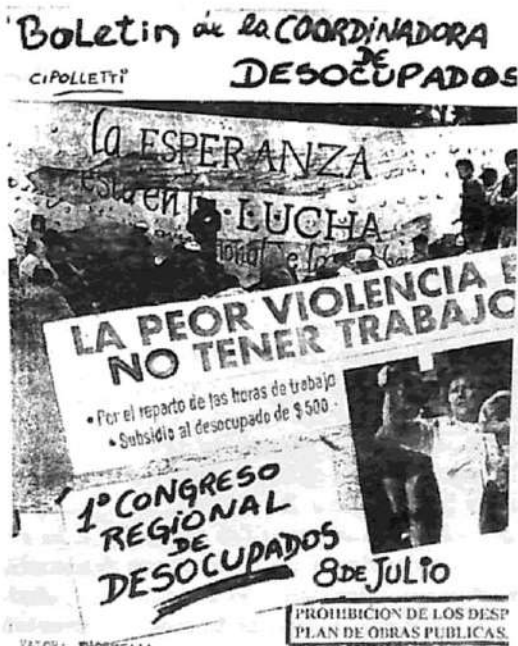
Boletín de la Coordinadora de Desocupados de Cipolletti

Un boletín editado por la Coordinadora de Desocupados de esta localidad declara: "Nos enorgullece realizar el 1° Congreso Regional de trabajadores desocupados de Río Negro y Neuquén... El motivo es el de organizarnos para sacarnos del callejón sin salida en el que nos han metido. Para evitar la explotación del hombre por el hombre. Por trabajo o subsidio de 500 pesos. Por la ampliación de los planes 'Trabajar' con cobertura médica para el desocupado y su familia. Que el Estado garantice terreno o vivienda para los sin techo. Por una educación pública y gratuita. Dinero hay, que la miseria la paguen los que se enriquecen con nosotros. Convocamos a las organizaciones de desocupados a sumarse a este