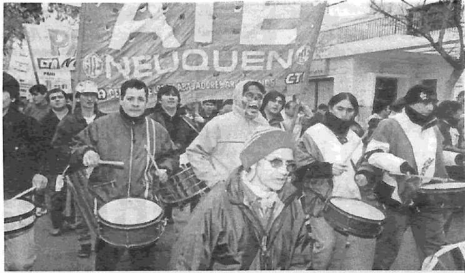
Movilización de ATE-Neuquén: para ganar, necesitamos la huelga general

La organización y participación de los desocupados en el Congreso Provin-