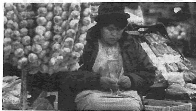
Detrás de los ataques a los compañeros bolivianos están la bonaerense, los organismos de seguridad y la 'patria inmobiliaria'. Hay que pararle la mano