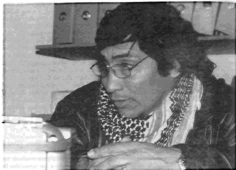
"... La administración municipal de Montevideo hoy está planteando 'productividad' y volver a los años del 1900"

Para el sindicato, si no se logró el 100%, logramos ganar una cosa muy importante. En primer lugar, la conciencia de los compañeros en el aspecto de que votar a los que estaban hoy no era la solución de los trabajadores. En segundo lugar, el asco que les dio a los compañeros y el odio de