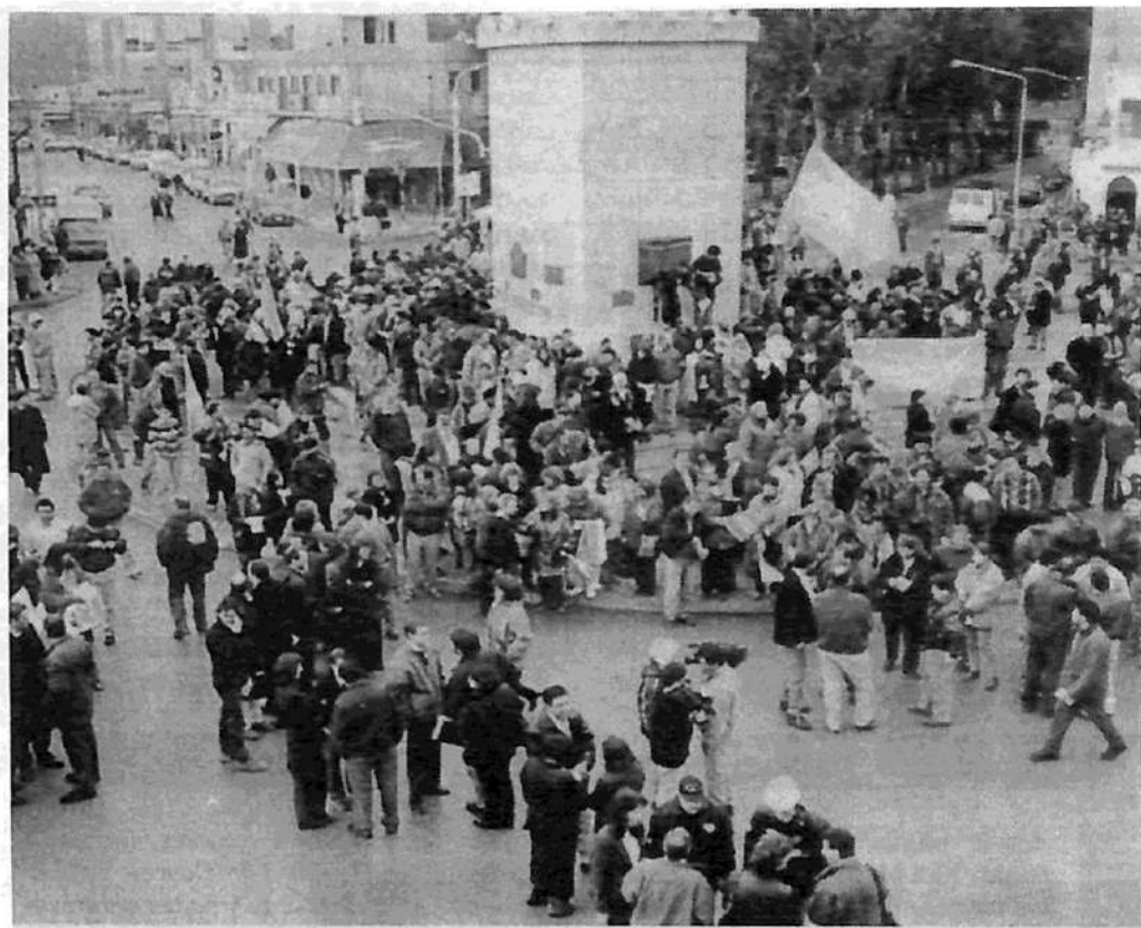
Esto es lo que juntaron las patronales y el gobierno, que pretendían reunir 10.000 personas contra el movimiento obrero.