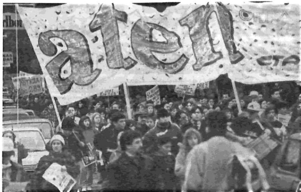
La victoria de los docentes reclama la huelga indefinida

Es entonces que una asamblea general de la seccional Capital de Aten resuelve por amplia mayoría el paro general indefinido , hasta lograr la renuncia de la secretaria de Educación, responsable del asesinato institucional de la compañera. (Solamente se opuso el Mst, que reclamó una medida 'realista' —paro de 48 horas—).