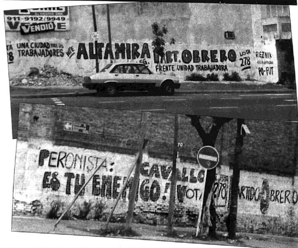
En la zona de Patricios, un grupo de obreros de mantenimiento de la Municipalidad ha constituido una brigada para salir a pintar paredones en favor de las candidaturas obreras y socialistas del Partido Obrero. En su mayoría viven en el Gran Buenos Aires. Pero al terminar la jornada de trabajo, a las 14 horas, salen a pintar "para derrotar a los candidatos patronales, y llevar a nuestros representantes a la Legislatura". Un ejemplo a seguir.