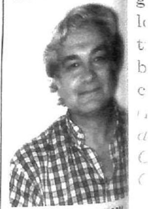
Sergio VILLAMIL Vice-Jefe de Gobierno