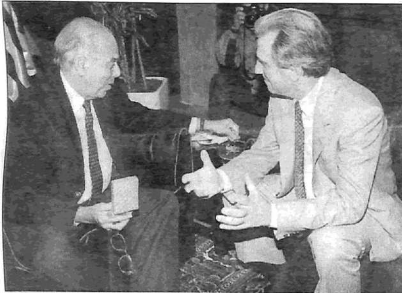
Jorge Battle y Tabaré Vázquez: como para Videla, "todos los desaparecidos están muertos".

El Encuentro Popular es presentado regularmente por el PC argentino como su 'modelo' de 'construcción política' y de 'acumulación de fuerzas'. En las últimas elecciones, Tabaré Vázquez recibió el apoyo, además del PC,