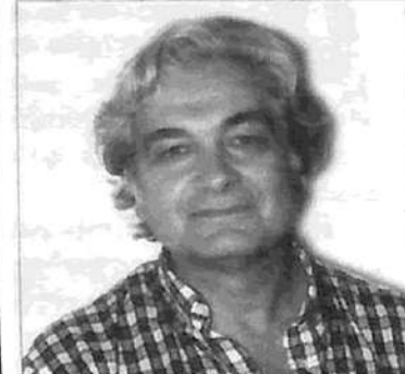
Sergio VILLAMIL Vice-Jefe de Gobierno