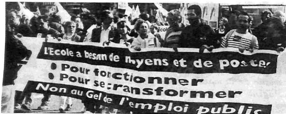
Mobilización estudiantil-docente contra la reforma educativa de la centroizquierda francesa: "La escuela necesita medios y puestos de trabajo. No al congelamiento del empleo público".

blicamente a su publicitado proyecto de reforma previsional: elevación de 37,5 a 40 años de aportes para jubilarse en el sector estatal, elevación de la edad jubilatoria (hoy en 60 años) y creación de un régimen de fondos de pensión. La amenaza de una rebelión generalizada lo obligó a 'congelarlo'. Jospin no olvida que, en diciembre de 1995, un proyecto similar del derechista Alain Juppé, provocó la mayor oleada huelguística y de manifestaciones de los últimos treinta años en Francia.