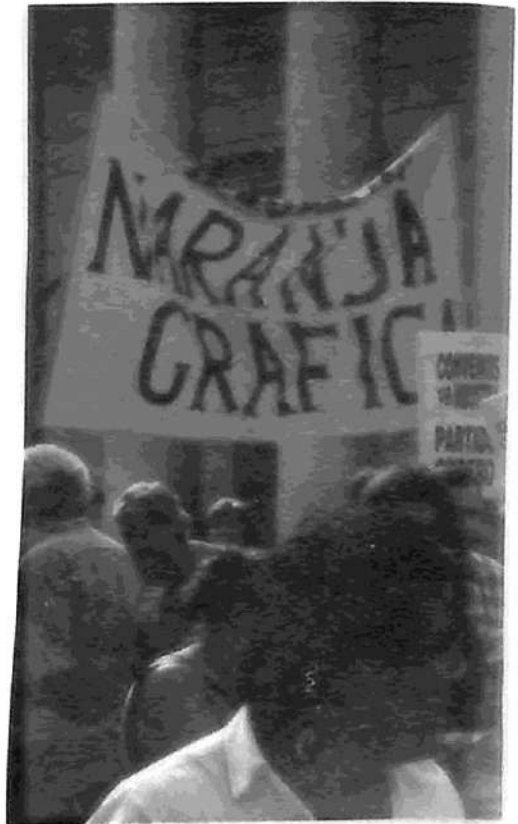
24 de febrero: La Naranja Gráfica se moviliza contra la reforma laboral.

✓ En la última asamblea general (del 17 de