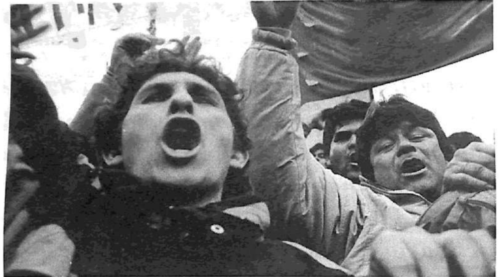
Hay que ganar la calle hasta que la ley privatista y antiobrera sea retirada de la Legislatura.

De la Sota lo acaba de reconocer ampliamente en un reportaje al diario Comercio y Justicia , defendiendo la privatización del juego y la instalación de casinos y máquinas tragamonedas para impulsar el negocio turístico: la provincia —dijo— debe "cambiar su perfil productivo ante los problemas en la industria".