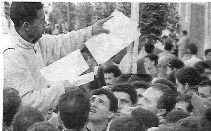
Asamblea de los braceros marroquíes.

En los primeros días de febrero, bandas fascistas tomaron como excusa el asesinato de una joven española para descargar su furia contra los braceros marroquíes. Tres de ellos fueron asesinados, y cientos de viviendas y algunas mezquitas fueron quemadas. Los instigadores de este verdadero 'progrom' fueron los propios patrones de la fruta. "Los propietarios de los invernaderos lo dicen abiertamente: 'Habrá un cambio de trabajadores, se traerán de Sudamérica, de Europa o de donde sea, pero con los moros no hay más que problemas'..." ( El País , 12/2). El 'problema' es, nada más ni nada menos, que el sindicato ATIME (Asociación de Trabajado-