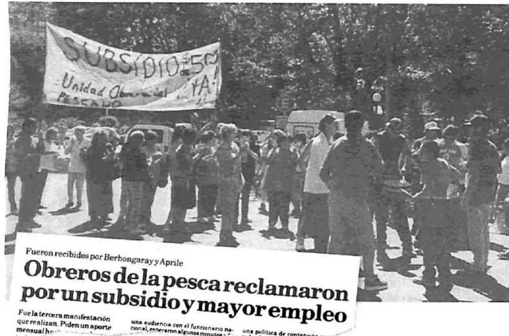
Movilización de los trabajadores del pescado. La Unidad Obrera del Pescado, presente.

Una cosa que yo quería agregar es que en el tema organizativo se están afiliando los compañeros masivamente a la Unidad Obrera del Pescado; ya en este caso tenemos entre 150 y 200 afiliados a la agrupación.