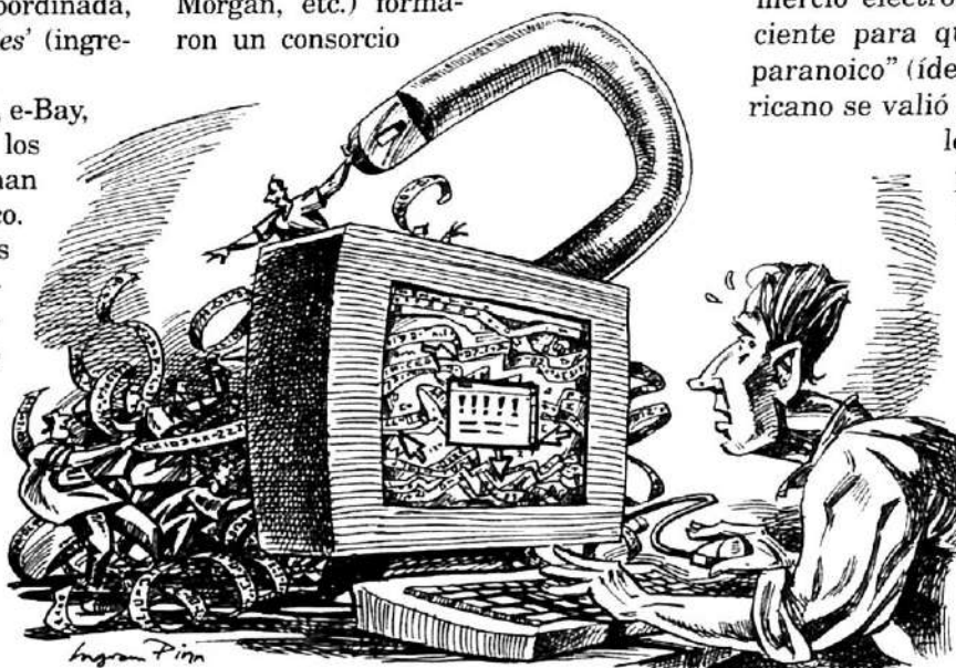
Ataque a los 'portales'. El imperialismo pretende más regimentación de Internet.

un aparente intento de poner a la red fuera de funcionamiento. "Estos bancos, dice un diario financiero, se comportaron como 'piratas'..." (ídem, 12/2). Recientemente, "el puñado de compañías que dominan los mayores mercados financieros del mundo y que nunca habían soñado colaborar unas con otras (Merrill Lynch, JP Morgan, etc.) formaron un consorcio