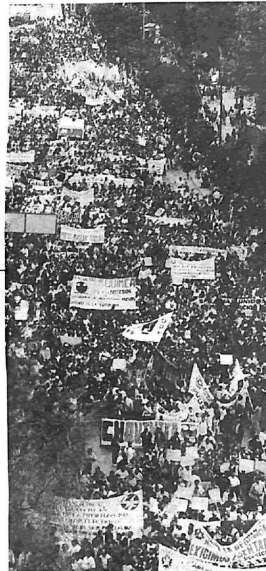
Manifestación en México por la libertad de los estudiantes detenidos. También en Argentina la juventud se moviliza.