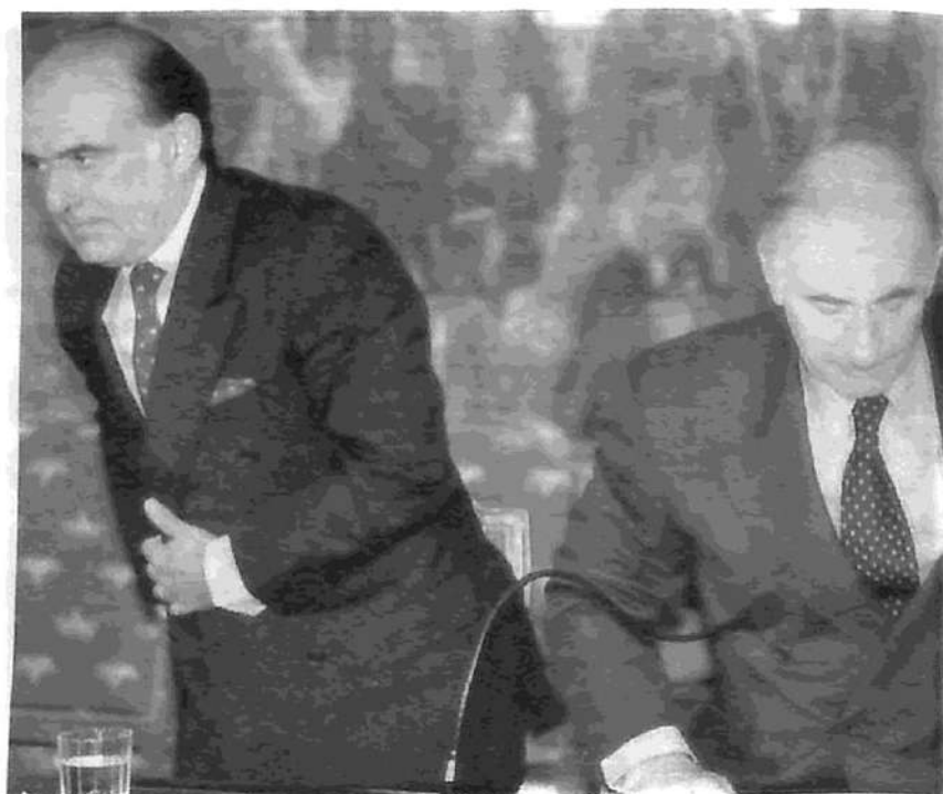
El ataque a las garantías ciudadanas plantea la movilización de las organizaciones obreras, de derechos humanos y de la juventud.