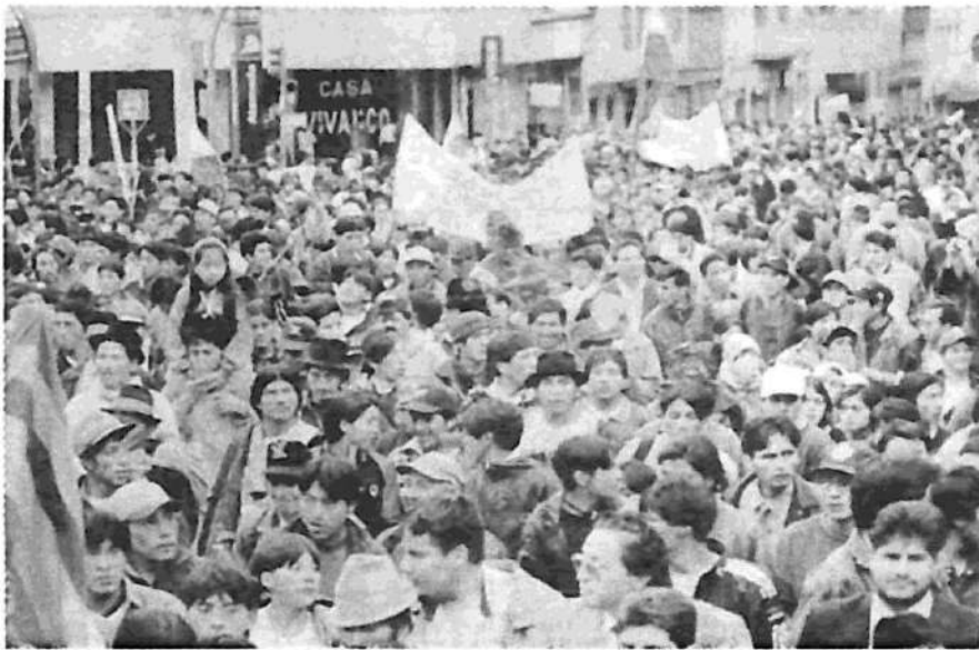
Quito: los indígenas marchando hacia el Congreso

'vación Nacional', encabezada por el coronel Lucio Gutiérrez e integrada por Antonio Vargas, el líder de la Conaie, y un ex juez de la Corte Suprema. En su primera in-