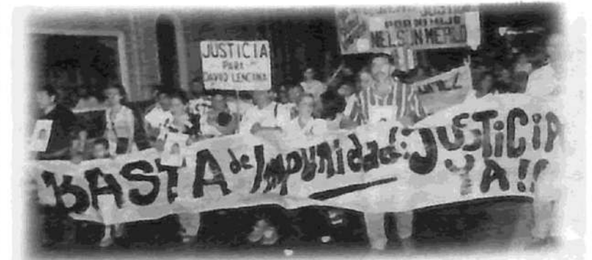
Cada Martes, Corrientes marcha por el juicio y castigo al "gatillo fácil"

más que un lavado de cara a una de las policías más 'bravas' e involucrada en atropellos y asesinatos de la juventud y los trabajadores. Todavía no se es-