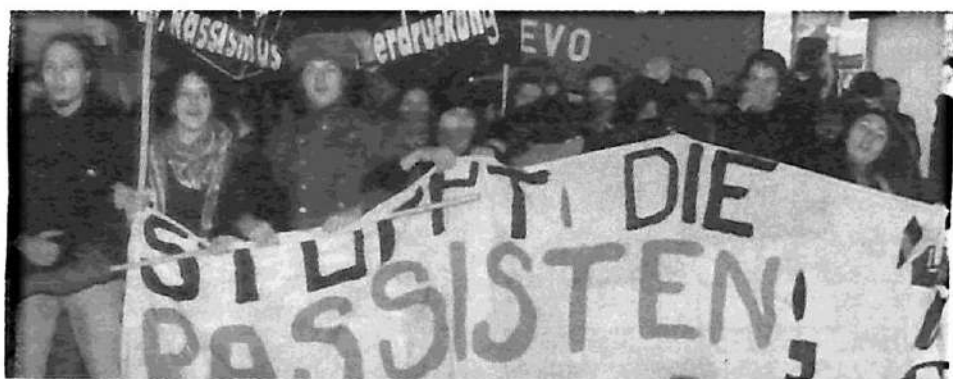
Viena: manifestaciones contra Haider

Los acontecimientos austriacos demuestran por qué la mayoría del imperialismo mundial sigue prefiriendo a los gobiernos centroizquierdistas. Lo que parece una presión del imperialismo contra Haider, es una presión sobre el Partido Socialista austriaco para que se avenga a una coalición