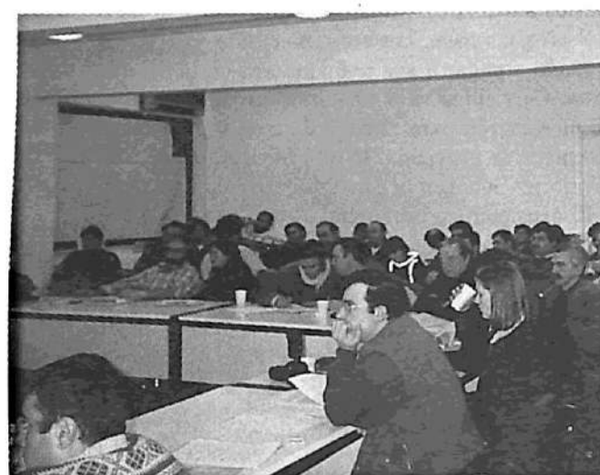
Conferencia Socialista Balcánica Anti-Otan: una parte de los delegados durante las deliberaciones

Comunista); Ergatiki Pali (Organización de Comunistas Internacionalistas de Grecia / Lucha Obrera, un grupo de simpatizantes del Secretariado Unificado), Ergatiki Exousia (Poder Obrero, un grupo pro-LIT); • De Rusia, el Partido Ruso de los Comunistas, la Organización Regional de Leningrado, la Unión de Internacionistas de Izquierda, la Asociación Internacional de estudiantes en por la Democracia y el Socialismo; • De Kurdistán, el Partido de Liberación del Kurdistán (Rizgari); • De la Argentina, el Partido Obrero.