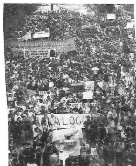
Una huelga histórica en defensa de la educación pública

La violencia policial desató una vasta ola de repudio popular al gobierno. En la misma noche del domingo, más de 20.000 personas marcharon por las calles de la capital para reclamar la inmediata liberación de los estudiantes detenidos.