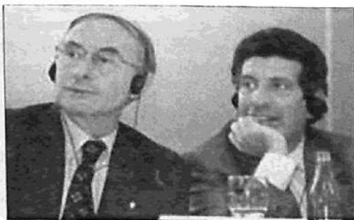
Del ‘Punto Final’ de Alfonsín al rechazo de las extradiciones de De La Rúa-Alvarez: una misma política de impunidad

Es que De la Rúa y la Alianza han ido más lejos que Menem en el rechazo a la extradición de 48 altos jefes de la dictadura, por parte del juez Garzón. De la Rúa, como Menem, “buscó mil maneras de garantizar que no hubiera un juez que comenzara a cazar militares en la calle; (y) consiguió esa certeza”. La Alianza no duda en violar la Constitución que, desde 1994, incluye las normas de la “Convención internacional contra la tortura y tratos crueles y denigrantes” y explícitamente esta-