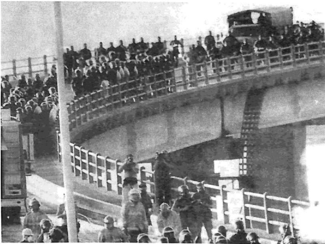
En Corrientes hay muchas reservas de lucha. Crece la necesidad de dar una respuesta. Es necesario un Congreso Provincial de Trabajadores.

Creemos, como sector docente, que la única forma de que la provincia salga del atolladero es buscar una salida, todos juntos. Pero que estemos en la lucha no quiere decir que vamos a vivir haciendo paros y marchas. La lucha tiene distintos matices y formas de hacerla. LA: Si no tenemos cierta organicidad tampoco vamos a poder crecer, porque va a ser una anarquía. Pero de esta manera horizontal y orgánica podemos tener la clave para nuestra nueva organización social acá, en Corrientes.