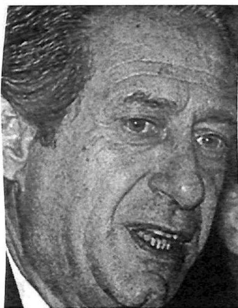
Escuelas 'chatarra' para destruir la educación pública: el 'modelo' que Llach quiere importar

amenaza para la hegemonía norteamericana. De no tomar medidas para elevar el nivel académico, la generación llamada a liderar el futuro podría dar por el traste con el tren de prosperidad de Estados Unidos en la segunda mitad de este siglo" (idem).