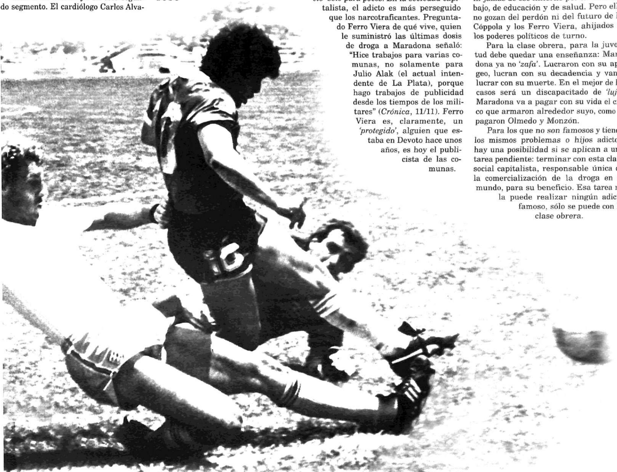
Mundial de México: El segundo gol a los ingleses. Lucraron con su apogeo, hoy lucran con su decadencia.

Para los que no son famosos y tienen los mismos problemas o hijos adictos, hay una posibilidad si se aplican a una tarea pendiente: terminar con esta clase social capitalista, responsable única de la comercialización de la droga en el mundo, para su beneficio. Esa tarea no la puede realizar ningún adicto famoso, sólo se puede con la clase obrera.