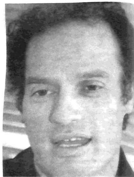
Aníbal Ibarra quiere a Beliz como aliado: un ‘progresista’ que no oculta su perfil reaccionario

Los puntos en común entre los candidatos son muchos. La “tolerancia cero” de Beliz, Cavallo que recorre comisarías, e Ibarra contactando a la policía londinense, recuerdan la campaña electoral de Ruckauf y Patti. La incorporación de