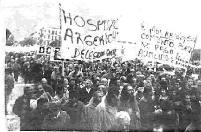
Movilización hospitalaria contra De la Rúa: la Capital es el centro de grandes luchas contra la flexibilización

Con la presencia de delegados y trabajadores de Metrovías, municipales, ATE, no docentes, docentes primarios y universitarios, empleados de comercio, de prensa, gráficos, de la alimentación, de la sanidad y del gremio metalúrgico, se reunió el plenario de trabajadores por la formación de un polo clasista en la Capital.