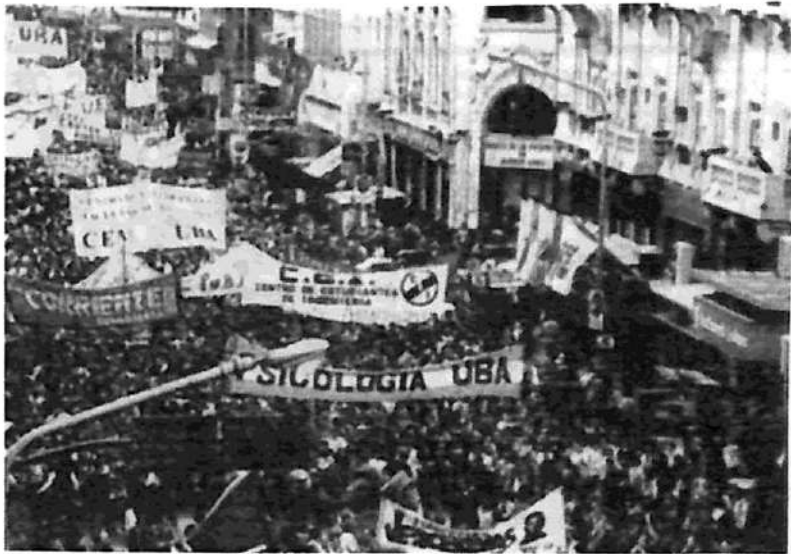
Los estudiantes debemos recuperar nuestros sindicatos para la lucha.

✓ Repudiamos con todas nuestras fuerzas la represión del gobierno nacional al pueblo correntino y reclamamos el inmediato retiro de la Gendarmería, la libertad de todos los